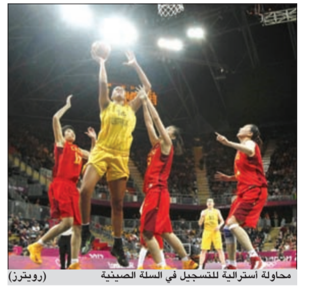
محاولة أسترالية للتسجيل في السلة الصينية

ضربت الولايات المتحدة التي حققت خمسة انتصارات في الدور الأول بقوة وتأهلت إلى نصف نهائي مسابقة كرة السلة للسيدات بفوزها الساحق على كندا 91-48 في دور الثمانية. وقادت ديانا توراسي (15 نقطة و4 تمريرات حاسمة و3 منباعات)، منتخب الولايات المتحدة حامل اللقب أعوام 1996 و2000 و2004 و2008، لبلوغ نصف النهائي حيث سيقاتل اليوم الخميس نظيره الأسترالي الفائز على الصين 75-60.