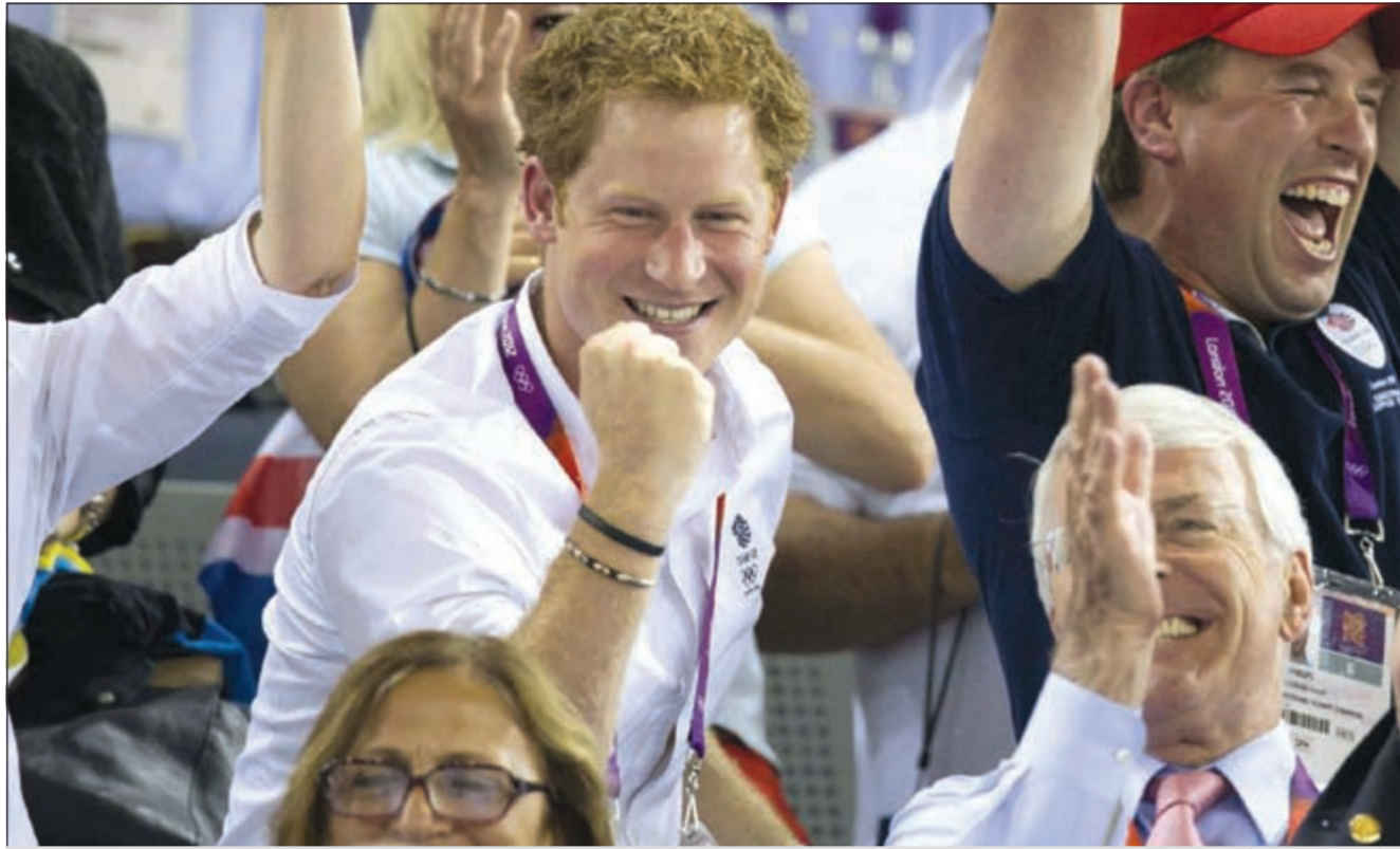
الأمير هاري يصفق لتروت بعد إحرازها الذهبية

أحرزت البريطانية لورا تروت ذهبية سباق اومنيوم الثلاثي ضمن رياضة الدراجات في دورة الألعاب الأولمبية في لندن. وبيات تروت (20 عاما) أول رياضية تحزن ذهبية هذا السباق الذي أدخل لأول مرة في الألعاب الأولمبية، وحلت أمام الأميركية