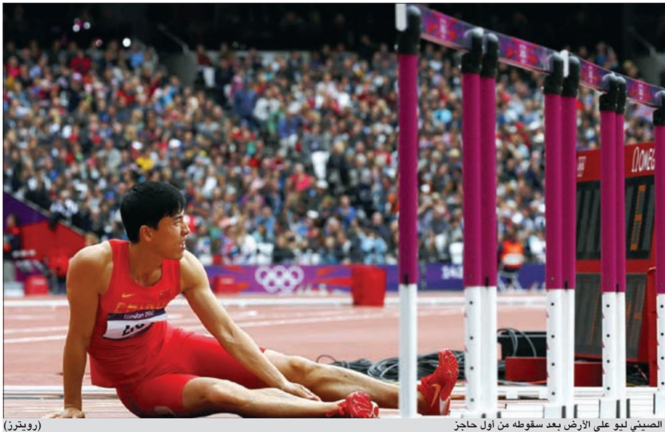
الصيني ليو على الأرض بعد سقوطه من أول حاجز

خرج الصيني تشانغ ليو من الدور الأول في تصفيات سباق 110م حواجز بعدما تعرض لقطع في وتر أخيل. وداس ليو، بطل أولمبياد اثينا 2004 وأحد المرشحين الأقوياء للفوز بالذهب، على عارضة الحاجز الأول فسقط أرضا وخرج من المنافسة وهو يعرج بسبب إصابة ربما في وتر أخيل قدمه اليميني ثم سعد إلى عربة نقل صغيرة انتجهت به إلى غرفة الإسعافات الأولية بعد أن كان مسرورا أمام الكاميرا خلال حركات التحمية قبل السباق كما أظهرته صور الكاميرا. وقال مسؤول الفريق الصيني فينغ شو يونغ: «التشخيص الأولي للفريق الطبي أنه تعرض لانقطاع في وتر أخيل. في السنوات الأخيرة خضع لعلاج طبي جيد، لكن الإصابة ما زالت متواجدة».