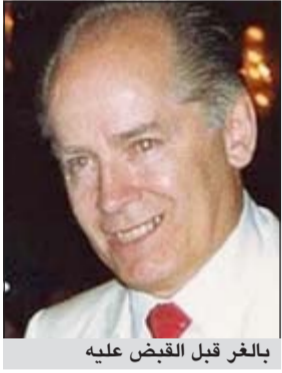
بالغر قبل القبض عليه

جاك نيكلسون في فيلم «ذي ديبارتد». وقد خصصت كتباً كثيرة لقصته أيضاً.