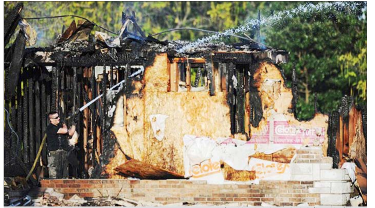
رجل إطفاء خلال مكافحة ما تبقى من الثيران التي اندلعت في المسجد