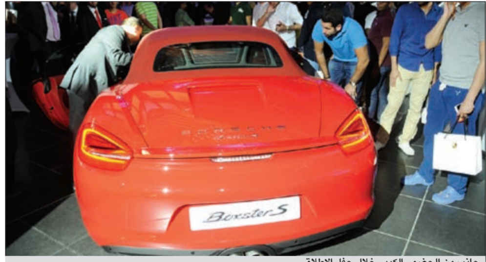
جانب من الحضور الكبير خلال حفل الإطلاق