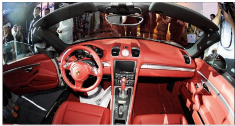
مقصورة رائعة للغاية

من خلال اتباعها مبادئ أداء بورشه الذي يحذاقها. وبعد الإطراء المذهل الذي حصلت عليه السيارة عقب تقديمها في معرض جنيف للسيارات، نحن متشوقون إلى تقديمها في منطقتنا. على الصعيد الميكانيكي، يندفع طراز بوكستر و«بوكستر إس» بمحركي بوكسر من ست أسطوانات مسطحة مزودان بتقنية حقن الوقود المباشر. وهما يتضمنان إدارة حرارية ونظام استرجاع للطاقة إلى النظام