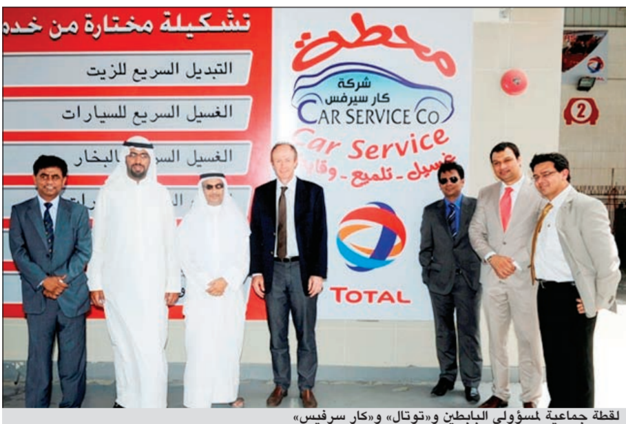
لقطة جماعية لمسؤولي الباطين و«توتال» و«كار سيرفيس»

يسعى إلى توفير أفضل الخدمات للعملاء من خلال فحص 16 نقطة أساسية في السيارة بشكل دوري.