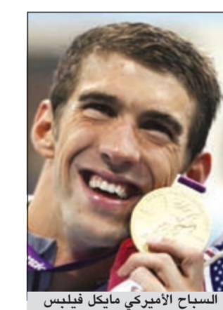
السباح الأميركي مايكل فيليبس

للسباحين، عندما تكون في المياه لمدة ساعتين لا تخرج من أجل التبول، الكلور يذوب كل شيء فلا يبدو الأمر مضرا». وأقر لوكتي يوم الجمعة الماضي في برنامج إذاعي أميركي بأنه يتبول في أحد حمامات السباحة خلال دورة لندن.