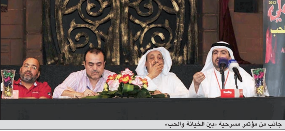
جانب من مؤتمر مسرحية «بين الخيانة والحب»