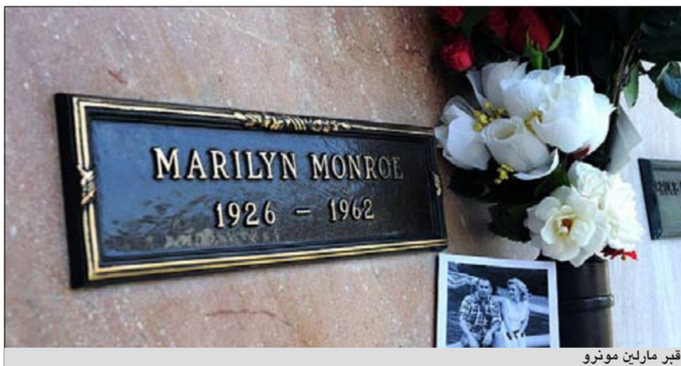
قبر مارلين مونرو

شعرها باللون الأشقر نفسه، وعلى غرار ديبي مشت على خطى مارلين طوال الأسبوع المنصرم مؤكدة أن «ما يبقى فعلا من النجمة في افلامها». وقالت «أشاهد هذه الأفلام مرارا وتكرارا ومع اني احاول ان أركز على زملاتها (في الأفلام) فإن عيني تبقيان شاخصتين إليها». وتساءلت منبتمسة «هل أتى احد آخر مثله منذ ذلك الحين؟ كلا، ثمة الكثير من النساء والممثلات الجميلات الآن، إلا ان ما من احد مثلها!».