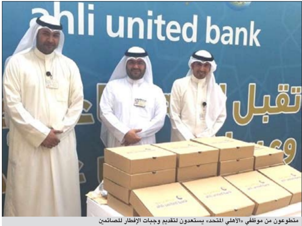
متطوعون من موظفي «الأهلي المتحد» يستعدون لتقديم وجبات الإفطار للصائمين

اتصالا من حرص البنك الأهلي المتحد على تفعيل التواصل والترابط الاجتماعي خلال شهر رمضان المبارك، يقدم البنك مجموعة من الأنشطة الخيرية والتطوعية والثقافية والدينية وأعمال الرعاية الاجتماعية، تشمل على العديد من المبادرات والمساهمات التطوعية والخيرية، ودعم لعدد من الأنشطة المتميزة وإقامة ندوات دينية ومسابقات للموظفين تهدف إلى نشر المعرفة والإطلاع وبث روح البهجة والتلاحم التي تتميز بها شهر رمضان الفضيل بالإضافة إلى توزيع القرقيعان وإمسكية شهر رمضان.