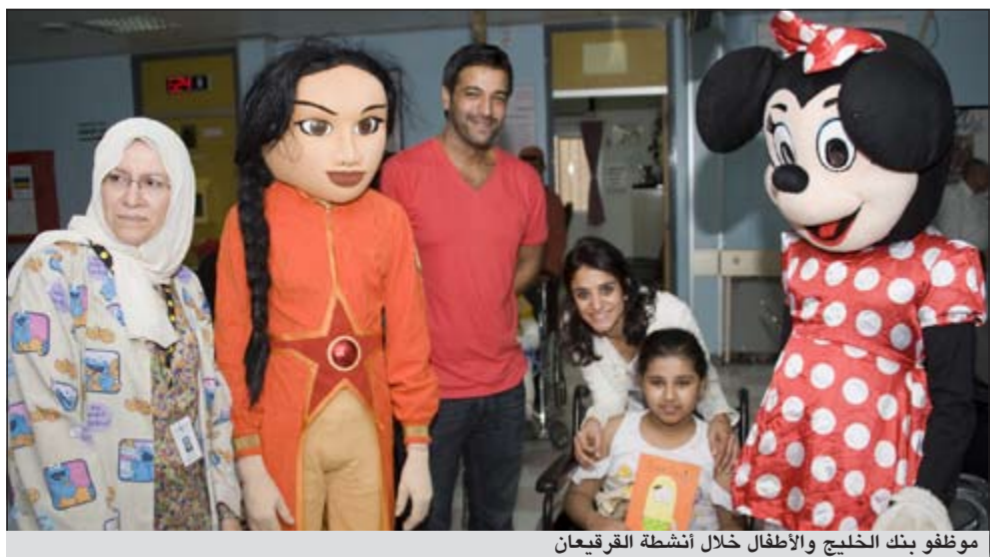
موظفو بنك الخليج والأطفال خلال أنشطة القرقيعان

قام عدد من موظفي بنك الخليج مؤخرا باستكمال برنامج زيارات البنك السنوية إلى وحدات العناية في المستشفيات التابعة للمجموعة الكويتية لرعاية الأطفال في المستشفيات، وبدأت هذه المجموعة الثانية من الزيارات إلى كل من مستشفى ابن سينا والأميري ومستشفى البنك الوطني، واختتمت بمستشفيات الفروانية والرازي وزيين والجهداء. وقد تلكت الزيارات إلى إضفاء أجواء من البهجة والمرح، ومنح الفرصة للأطفال للاستمتاع بليالي الشهر الفضيل بتقديم الأكياس المملئة بالقرقيعان، بالإضافة