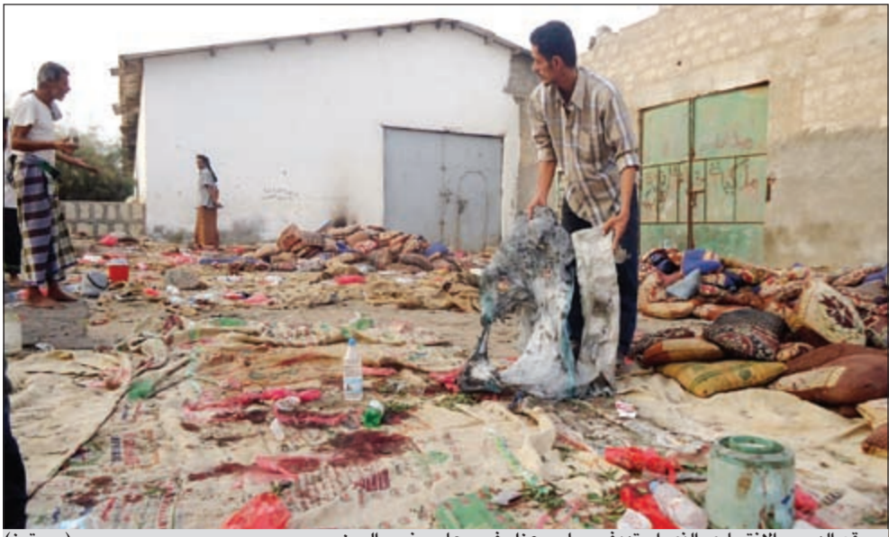
موقع الهجوم الانتحاري الذي استهدف مجلس عزاء في جعار جنوب اليمن