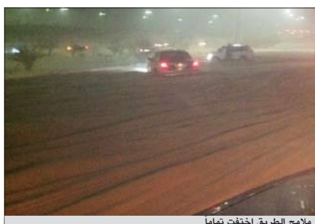
ملاحح الطريق اختفت تماما

شكاوى من قبل اهالي المنطقة من المستهترين الذين حاولوا تكسير الدوريات التي لم تترك لهم فرصة وفضوا التجمع وتم سحب السيارات المخالفة لقانون المرور واحالتها للحجز. ● هاني الظفيري - محمد الجلامه