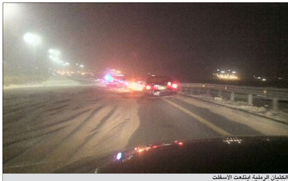
الكتبان الرملية ابتلعت الأسفلت

تسببت موجة الغبار التي اجتاحت البلاد باستنفار كل رجال دوريات مرور إدارة الجهراء بتعليمات من مديرهم العميد محمد الخالدي الذي أمر بتسريح الدوريات من الأسواق والمناطق الداخلية وإعادة نشرها في الطرق الخارجية المحيطة بمنطقة الجهراء بعد أن تحولت تلك الطرقات إلى ما يشبه الطرق الصحراوية بعد أن غطتها الكتبان الرملية، وقال مصدر أمني أن العميد الخالدي لجأ إلى إعادة الانتشار تلك بعد أن وردت عدة اتصالات من مستخدمي طرق الجهراء الرئيسية من أنها مغطاة بالكامل بالكتبان الرملية ويمكن أن تتسبب بحوادث مرورية وتشكل خطرا كبيرا على السائقين، وعليه أمر الخالدي بإعادة توزيع الدوريات تحديدا عند الشوارع الأكثر تضررا بالكتبان الرملية، وقال المصدر أن توزيع الدوريات كان يهدف إلى تأمين المنطقة وثانيا لتكون قريبة من هذه المواقع التي يحتمل أن تشهد حوادث، وأضاف المصدر أن العميد الخالدي قام بمخاطبة جهات الاختصاص لسرعة تنظيف الشوارع وإزالة الكتبان الرملية من الطرقات ورفع تقرير بذلك.