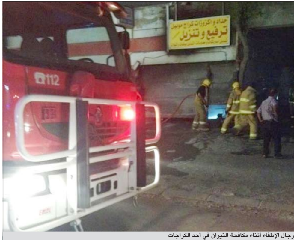
رجال الإطفاء أثناء مكافحة النيران في أحد الكراجات