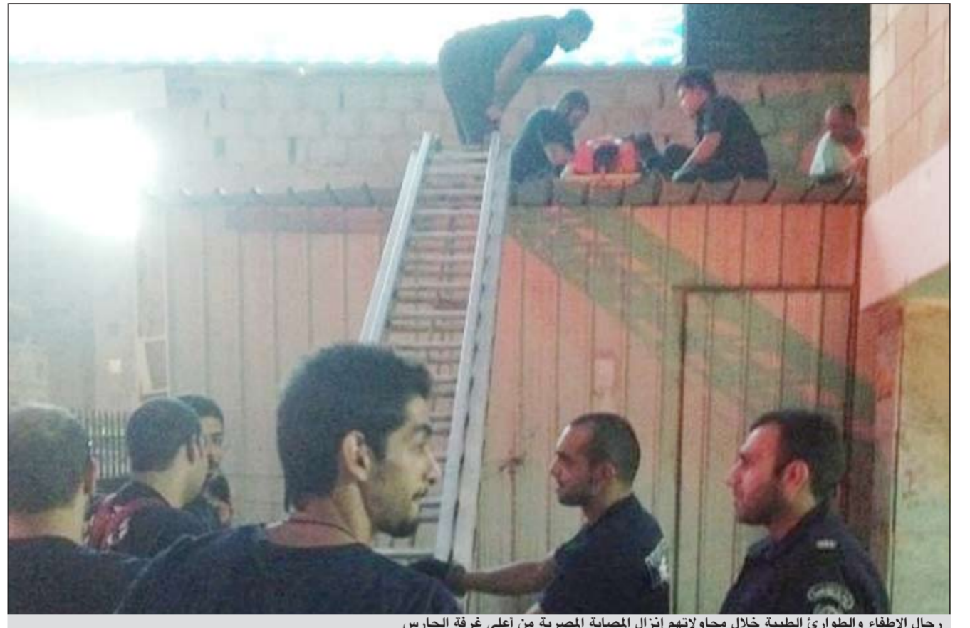
رجال الإطفاء والطوارئ الطبية خلال محاولاتهم إنزال المصابة المصرية من أعلى غرفة الحارس

بالساعات وأنه دائما ما تستنجد بالجيران والحارس لإخراجها، وبمواجهة الزوج بإفادات الجيران والحارس اعترف بأنه كان يحبها عندما يذهب إلى عمله ولا يسمح لها بالخروج وعليه تم احتجازه في نظارة المخفر تمهيدا لإحالة إلى النيابة العامة.