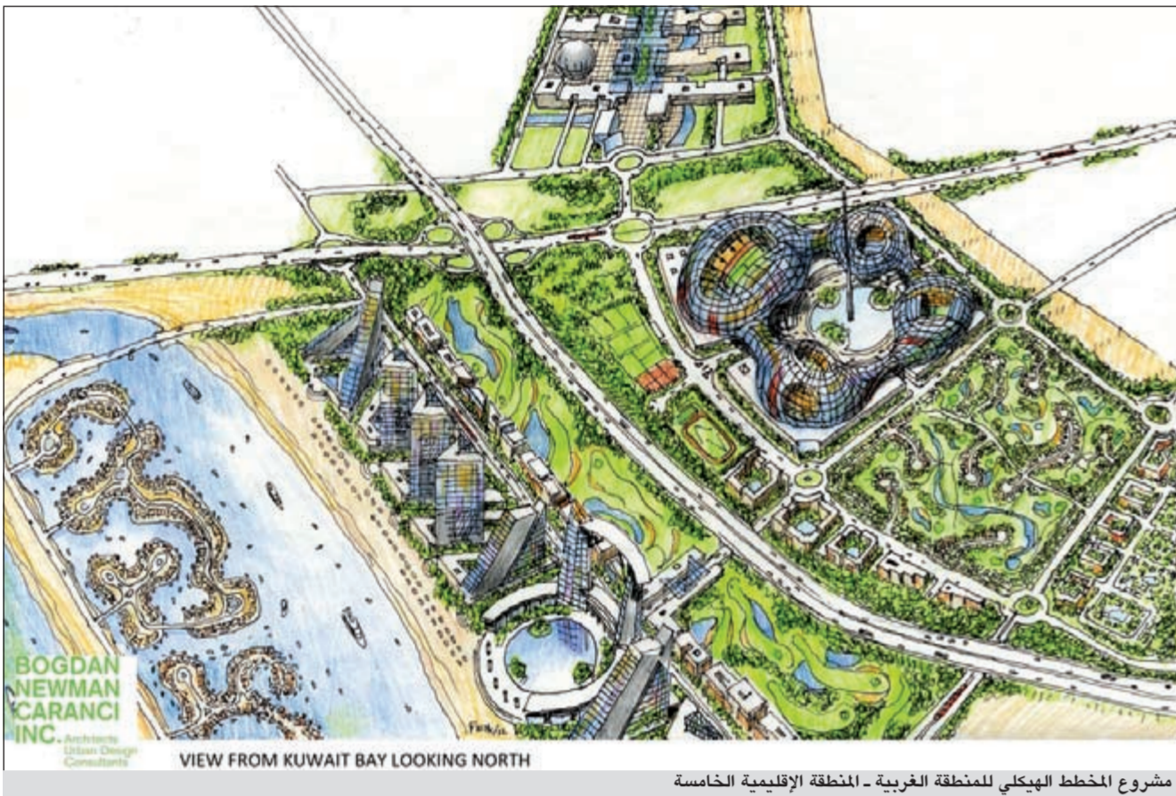
مشروع المخطط الهيكلي للمنطقة الغربية - المنطقة الإقليمية الخامسة