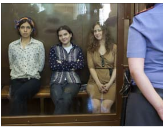
الشابات الثلاث في قصص الاتهام خلال المحاكمة

موسكو - أ.ف.ب.؛ صرح الرئيس الروسي فلاديمير بوتين أنه لا يريد فرض عقوبة قاسية على ثلاث شابات في فرقة «بوسي رايت» الروسية لموسيقى المانك ادين لادائهن أغنية مناهضة له في كاتدرائية موسكو في فبراير. وفي أول رد فعل على هذه القضية، قال بوتين في تصريحات نقلتها وكالات الأنباء الروسية الخميس «ليس هناك أي شيء جيد في ما فعلته لكنني أعتقد أنه يجب ألا يحاكمن بقسوة».