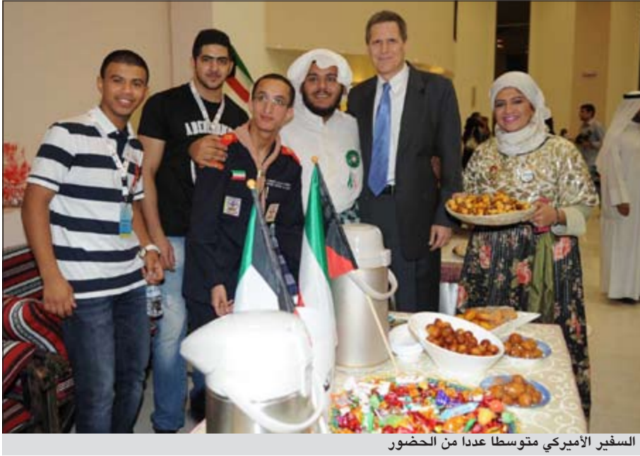
السفير الأمريكي متوسطا عددا من الحضور