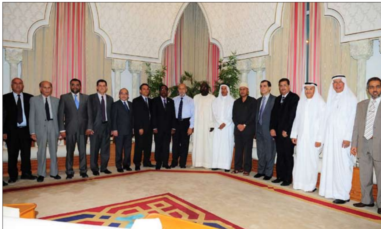
جانب من أهالي فيلكا في صورة جماعية