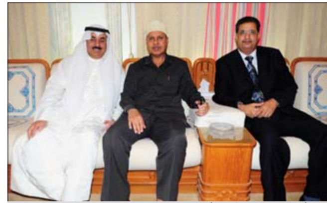
السفير الصومالي حضر الإفطار