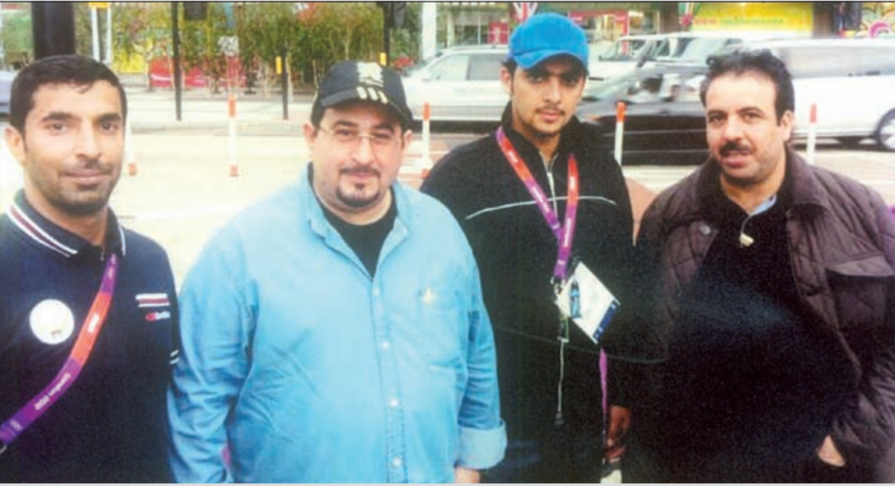
الشيخ فهد جابر العلي في الأولمبياد

فهد جابر العلي حضر الافتتاح واجتمع مع رئيس الاتحاد الدولي لرفع الأثقال