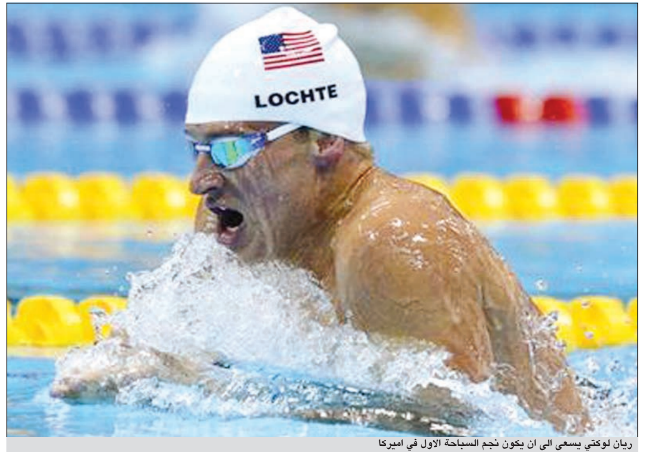
ريان لوكتي يسعى الى ان يكون نجم السباحة الاول في اميركا

إن من صميم الطبيعة البشرية القيام بأعمال تبدو جيدة حقا على الورق، ولكن المرء في مرحلة ما سيكون عليه أن يتحقق من درجة غروره ويفكر: هل أريد التضحية بهذا السباق كنوع من التسوية؟