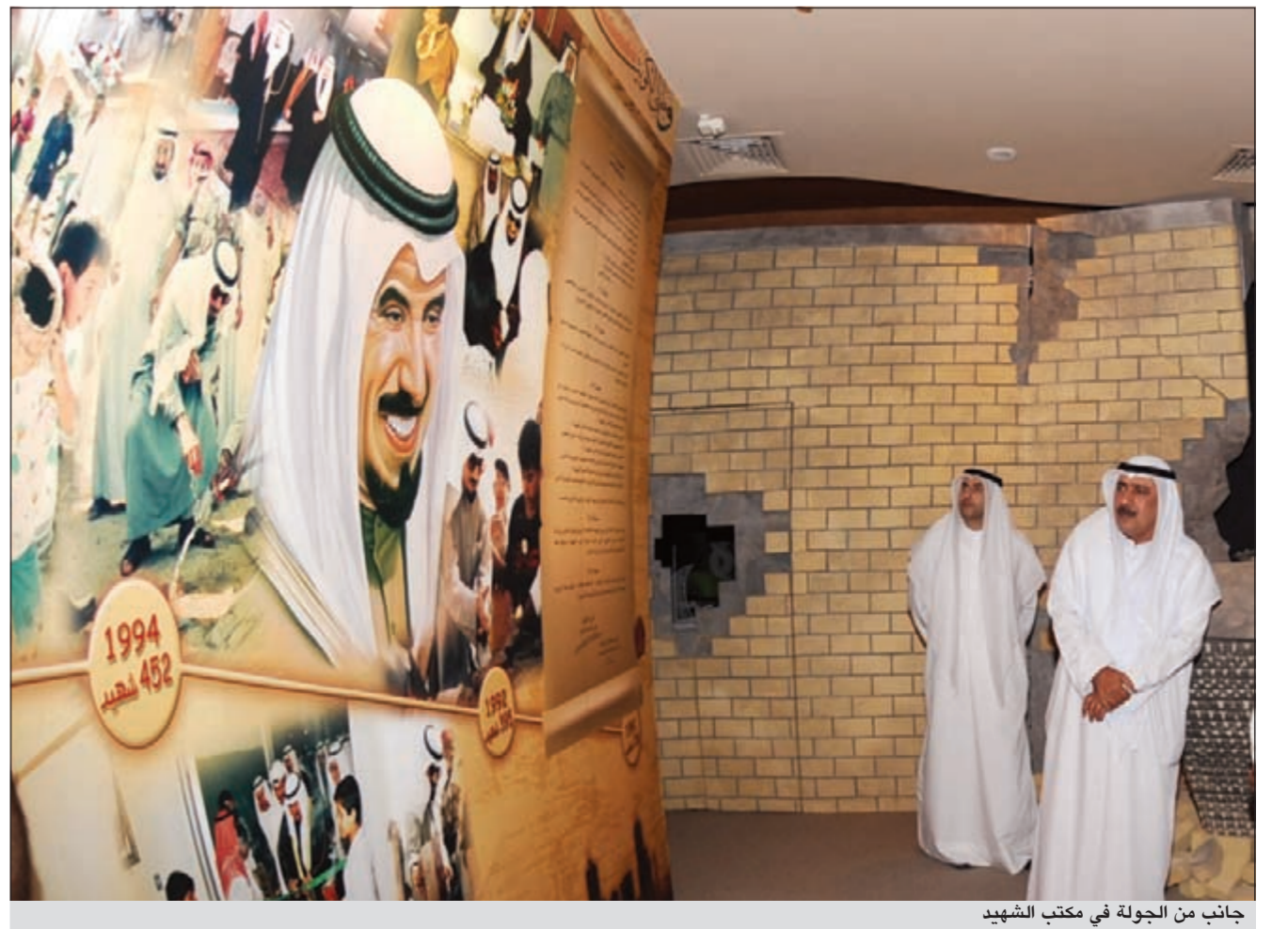
جانب من الجولة في مكتب الشهيد