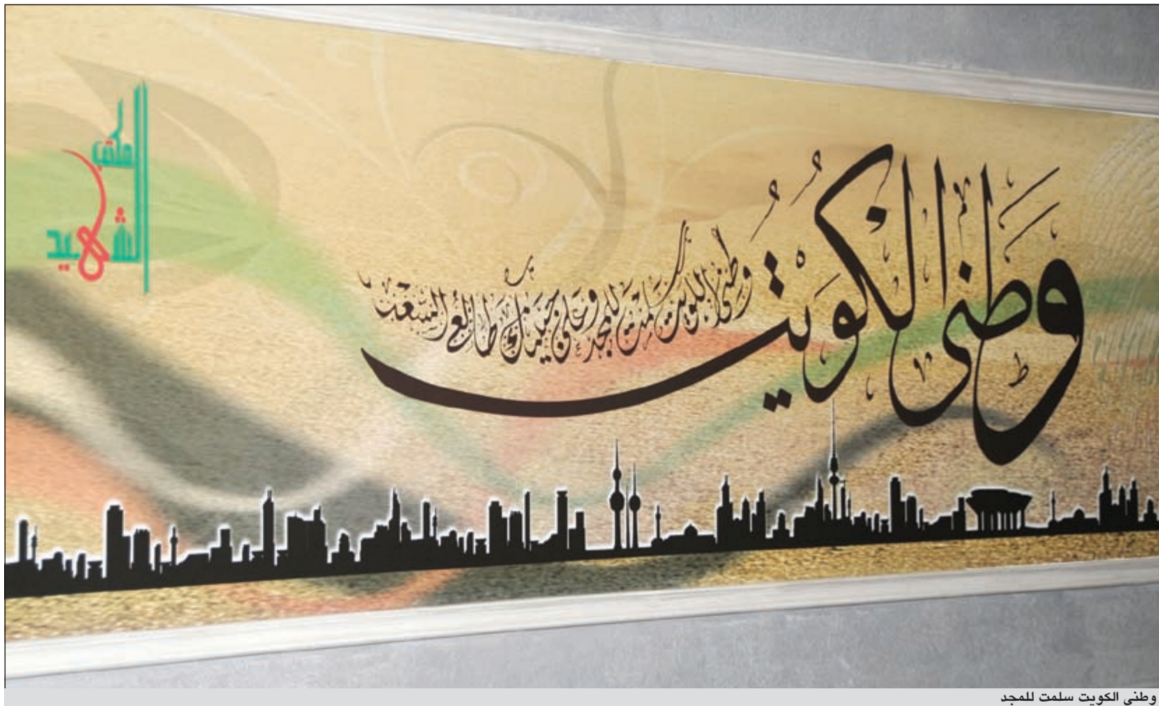
وطني الكويت سلمت للمجد