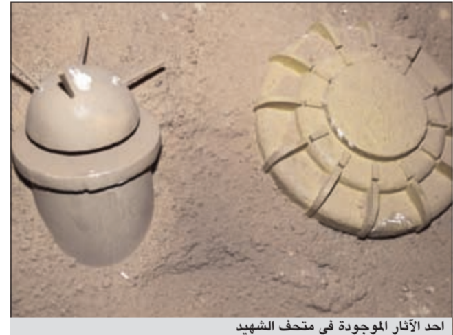
أحد الآثار الموجودة في متحف الشهيد

إن أقل ما يمكن تقديمه أمام الدور البطولي الذي قام به شهداؤنا الأبرار أبان الغزو الصادمي الفاشم، وما بذلوه من دماء طاهرة وتضحيات لأجل هذه الأرض المعطاء، هو الإصرار على إيماننا واعتقادنا المطلق بأن «الكويت توحدنا».