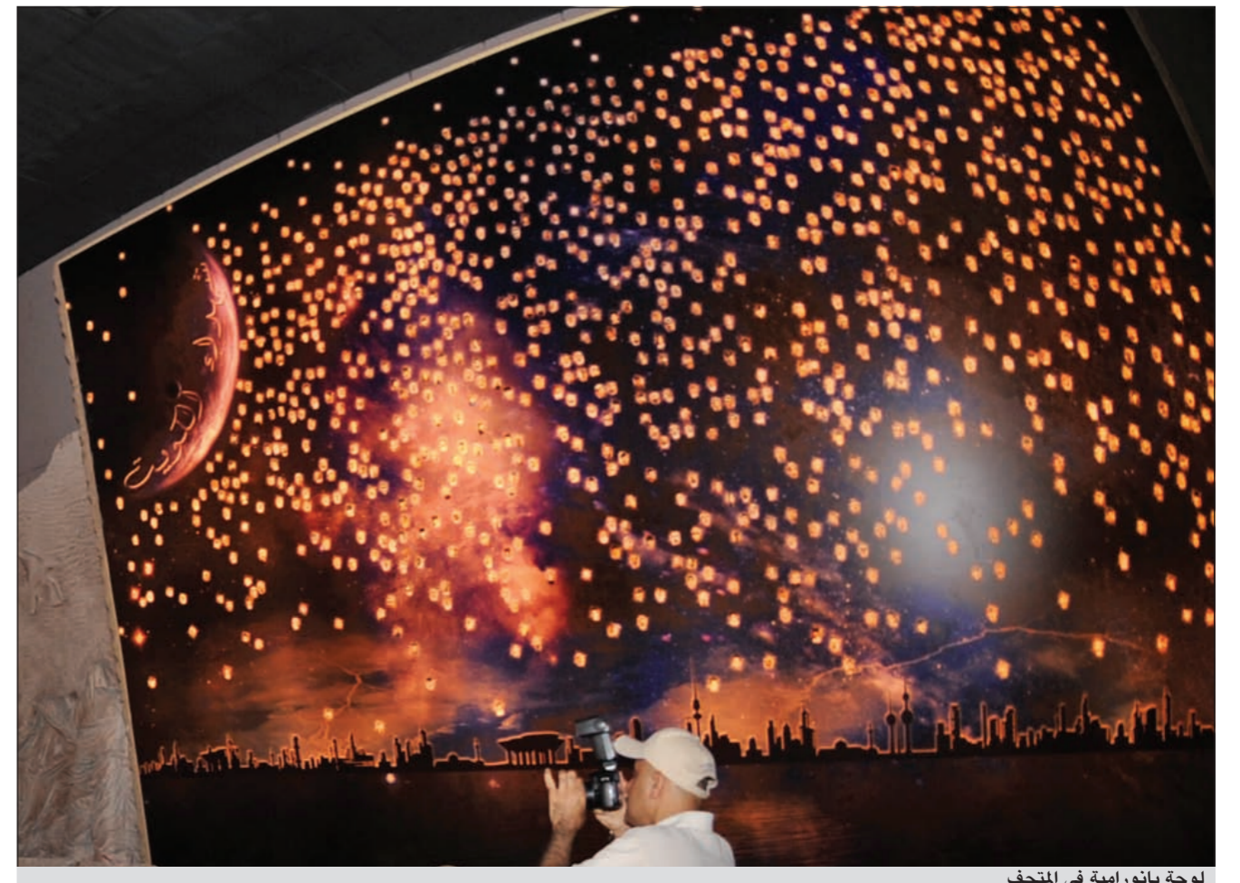
لوحة بانورامية في المتحف