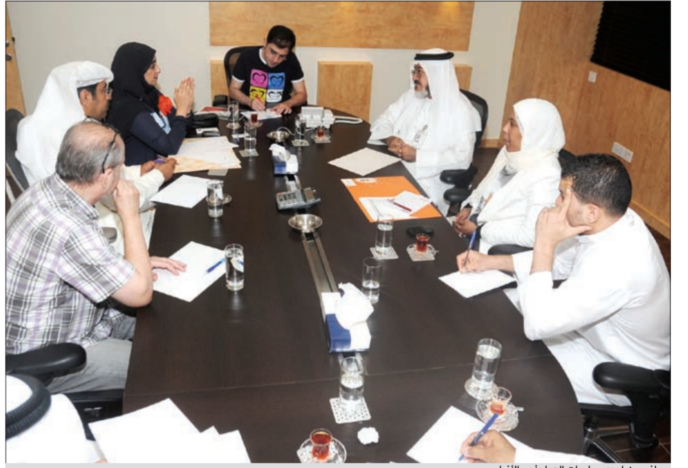
جانب من إحدى جلسات العمل في «الأنباء»