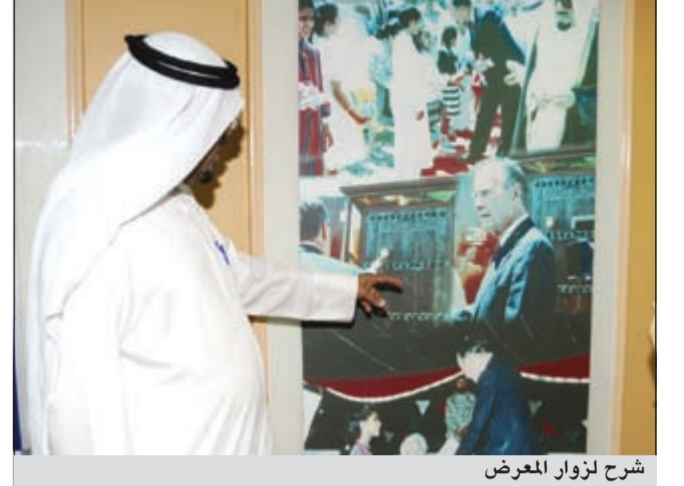
شرح لزوار المعرض