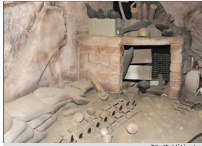
من مخلفات الاحتلال