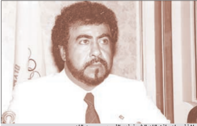
المغفور له بإذن الله الشيخ فهد الأحمد - رحمه الله