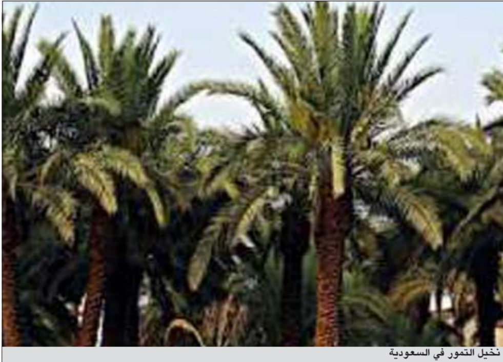
نخيل التمور في السعودية

ويمتاز بأنه ينضج في نهاية موسم التمور ويؤكل على شكل رطب أو تمر، يزن فرع النخلة حوالي 18,49 كغم، إذ تنتج النخلة كمية كبيرة من الثمار.