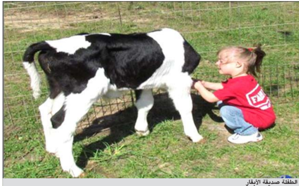
الطفلة صديقة الأبقار

موسكو - وكالات: عثرت الشرطة الروسية على طفلة عمرها 5 سنوات، تعيش مع قطع من الأبقار في منطقة «سوليكامسك» في جبال الأورال، وذلك بعد أن تلقت بلاغا من أحد جيران والد الطفلة يفيد بوجودها في حظيرة حيوانات تابعة لوالد الطفلة. وبحسب الشرطة، فإن الطفلة التي وجدت في حالة يرثي لها وليس عليها من الملابس إلا ما يستر عورتها، لم تكن قادرة على الكلام، مضيعة أنها كانت تتواصل عن طريق الخوار وتقليد صوت الأبقار. مستغربة من أنها كيف بقيت على قيد الحياة كل هذه المدة، وفقا لما أوردته صحيفة «الرياض». هكذا، وقد قامت الشرطة بإرسال الطفلة إلى مركز لإعادة التأهيل مهيدا لتسليمها لأسرة حاضنة. يشار إلى أن هذه ليست