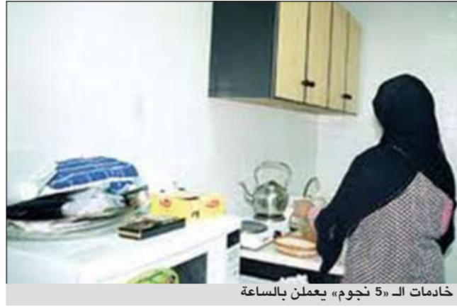
خادمات الـ «5 نجوم» يعملن بالساعة