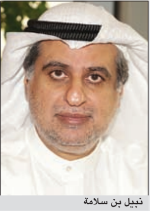
زين بن سلامة

أعلنت مجموعة زين عن توقيعها عقد شراكة إستراتيجية مع شركة بي سي سي ديليو العالمية - والتي تتخذ من هونغ كونغ مقراً لها - وذلك للتعاون في مجالات خدمات الاتصالات الدولية. وكشفت المجموعة في بيان صحفي أن هذه الاتفاقية المشتركة ستزود عملياتها في منطقة الشرق الأوسط بمجموعة واسعة من الحلول العملية لخدمات ربط شبكات الاتصالات الدولية. ونكرت «زين» أن هذه الشراكة ستساعد على كثرها في تقديم سلسلة طويلة من أطر الربط «السحابية» لعملياتها التشغيلية في ثمان دول في المنطقة، مبيّنة أنها