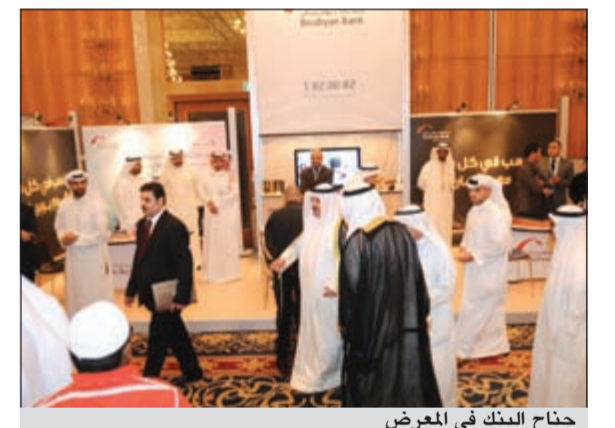
جناح البنك في المعرض

يشهد جناح بنك بويان في معرض العقار الرمضاني المقام حالياً والذي يستمر حتى اليوم إقبالا مميزاً من قبل زوار المعرض الراغبين في التعرف على منتجات وخدمات البنك المميزة. وقد قسام موظفو البنك بالإجابة عن جميع الاستفسارات والتساؤلات التي تتعلق بخدمات ومنتجات البنك التي طرحها مؤخراً في السوق الكويتي والتي تستهدف مختلف الشرائح وتلبي جميع الاحتياجات إلى جانب استعراض أبرز الخدمات والعروض التسويقية الجديدة والحلول التمولية التي يقدمها لمختلف القطاعات في الكويت، كما قاموا بالتعرف عن أحدث حملات البنك التي يقدمها لعملائه تحت اسم «الذهب في كل مكان مع بويان» التي تتبع لعملاء البنك من أصحاب باقات حسابات الرواتب المختلفة «أنت» و«حيك» و«ويك» إلى جانب حساب النخبة «بيلانسيوم» فرصة مضمونة للفوز بإحدى سبائك الذهب المقدمة من هذه الحملة والتي تتراوح أوزانها بين 2.5 - 5 - 10 - 50 - 100 - 1000 غرام، وذلك ضمن حملات البنك الترويجية التي عمل على إطلاقها في الفترة الأخيرة.