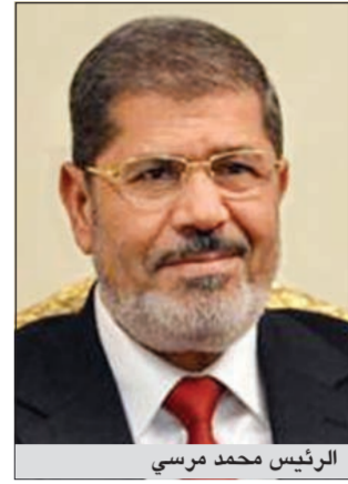
الرئيس محمد مرسي