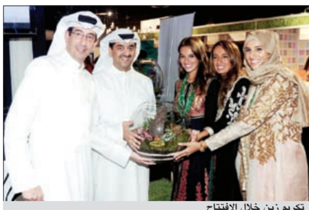
تكريم زين خلال الافتتاح

وأشارت الشركة أنها مستمرة بدعم هذه الفعاليات والأنشطة الاجتماعية ضمن جدول الشركة الحافل في شهر رمضان الكريم باعتبارها واحدة من أكبر المؤسسات الاقتصادية في الدولة، وعلى هذا الأساس تسعى باستمرار إلى القيام بتنفيذ سلسلة متنوعة من البرامج والفعاليات التي تخدم في المقام الأول المجتمع الكويتي.