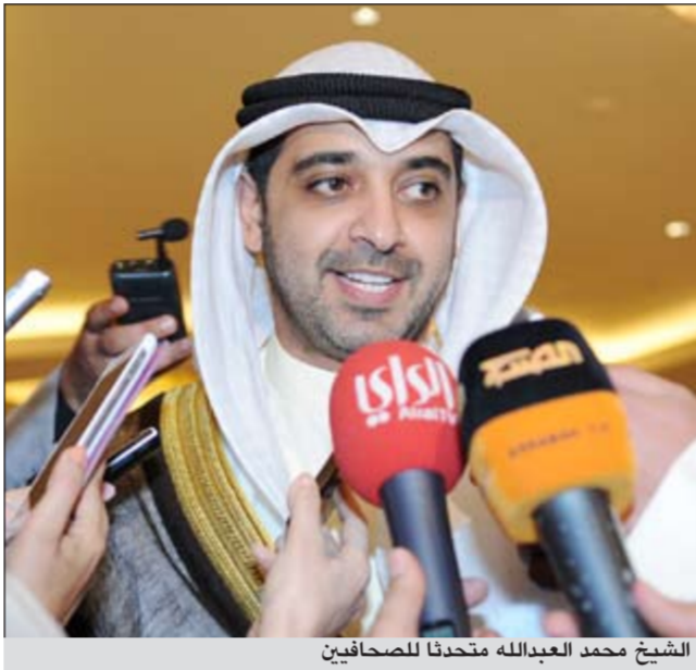
الشيخ محمد العبدالله متحدنا للصحافيين