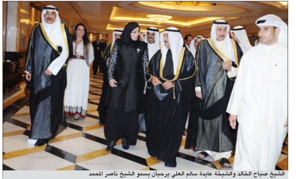
الشيخ صباح الخالد والشيخة عايدة سالم العلي يرحبان بسمو الشيخ ناصر المحمد

ورد في خطة الجامعة العربية والتي أصبح مندوبها أيضا كوفي انان وما صدر من مجلس الأمن من قرارات، وهدفنا الأساسي والرئيسي في التعامل في أي قضية سياسية هو حفظ أرواح المدنيين وحسن تقديم الاحتياجات الإنسانية لهم، ونحن نسعى كحكومة الكويت لتوفير الغطاء الإنساني للاجئين ونعمل وفق هذه القرارات.