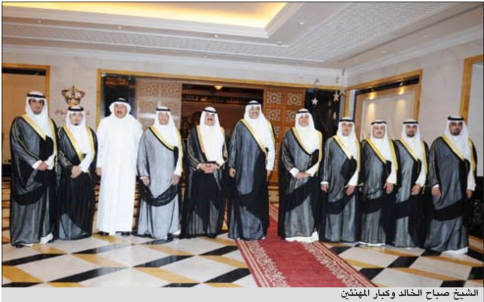
الشيخ صباح الخالد وكبار المهنيين

خلال الغبة الرمضانية لنائب رئيس الوزراء ووزير الخارجية الشيخ صباح الخالد بفندق الريحيني