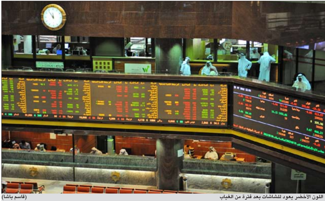
اللون الأخضر يعود للشاشات بعد فترة من الغياب

استهل سوق الكويت للأوراق المالية تعاملات الأسبوع على تذبذب في أداء مؤشرات الثلاثة، وأنهى تعاملات جلسة أمس على ارتفاع في لحظات الإقبال، حيث ارتفع المؤشر السعري بمقدار محدود أقل من نقطتين ليظل دون مستوى 5850 نقطة باستقراره عند مستوى 5748 نقطة، أما المؤشر الوزني فشهد ارتفاعاً بمقدار 1,98 نقطة ولكنه لم يصل بعد إلى مستوى 400 نقطة الذي كان قد خسره في ثاني جلسات الأسبوع الماضي، واستقر المؤشر عند مستوى 398 نقطة، أما المؤشر الجديد كويت 15 فشهد ارتفاعاً كبيراً قبل نهاية الجلسة بواقع 7,53 نقاط ليصل إلى مستوى 965,4 نقطة وذلك على إثر النشاط الملحوظ لعدد من الأسهم التي يتكون منها وفي مقدمتها سهم الوطني.