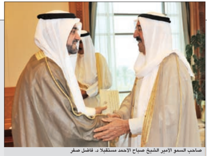
صاحب السمو الأمير الشيخ صباح الأحمد مستقبلاً د. فاضل صفر

صاحب السمو شهد أداء اليمين الدستورية لصفر وزيراً للأشغال