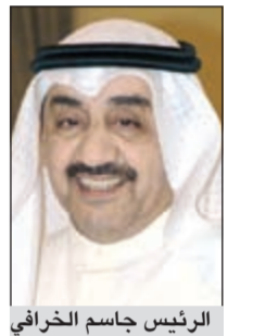
الرئيس جاسم الخرافي

أعلن رئيس مجلس الأمة جاسم الخرافي أنه تبلغ بحضور الحكومة جلسة المجلس المقرر عقدها غدا الثلاثاء، وذلك في إطار الإجراءات الدستورية الواجب اتباعها لتنفيذ حكم المحكمة الدستورية. وأضاف في تصريح للصحافيين أن النائب خالد العبدوة اعتذر عن عدم حضور الجلسة، وأنه لم يتسلم أي اعتذارات أخرى. مؤكداً أنه لا يستطيع الجزم بإمكانية توافر النصاب اللازم لعقد الجلسة من عدمه. وأوضح أن النائب د.محمد الحويطة قدم استقالته أمس من عضوية المجلس لكن لم يتسن إدراجها على جدول أعمال الجلسة، كما تسلم الأسبوع الماضي استقالة النائب محمد المطير، وتم إدراجها على بند الأوراق والرسائل الواردة.