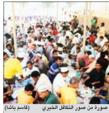
صورة من صور التكافل الخيري