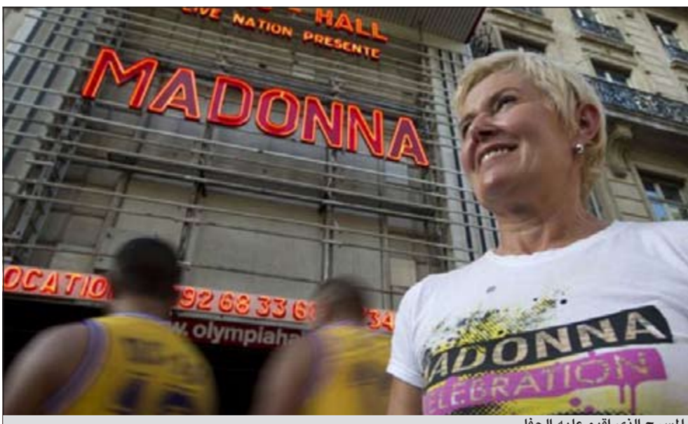
المرشح الذي أقيم عليه الحفل

باريس - أ.ف.ب: ابدي مستخدمو الإنترنت في فرنسا الجمعة على موقعي فيسبوك وتويتر استياءهم من قصر مدة الحفل الذي قدمته مغنية البوب الأميركية مادونا مساء الخميس في مسرح «أولمبيا» في باريس، إذ اقتصر على 45 دقيقة غادرت من بعدها دون أن تودع الحضور الذي وصل عدده إلى 2700 شخص.