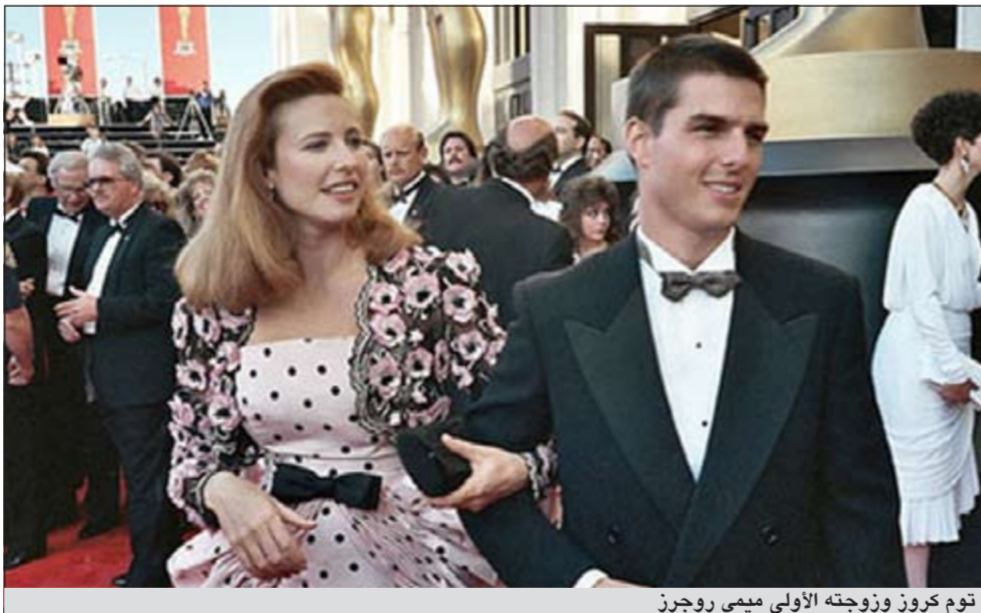
توم كروز وزوجته الأولى ميجي روجرز

وكالات: مازال طلاق النجم توم كروز من زوجته المثقلة كيتي هولمز الشغل الشاغل للصحافة حول العالم، ويحاول كثيرون إيجاد الأسباب الخفية لهذا الانفصال، لكن ما هو سر انفصال كروز عن زوجته بشكل عام عند بلوغهن سن الـ 33؟