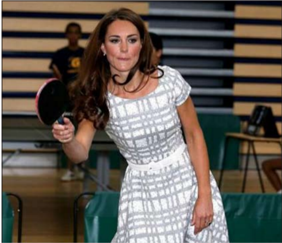
الدوقة كيت ميدلتون بالفستان المثير للجدل

شاركت دوقة كامبريدج كيت ميدلتون رفقة زوجها الأمير ويليام وشقيقه الأمير هاري للمشاركة في مناسبة رياضية على هامش بدء الألعاب الأولمبية في بريطانيا.