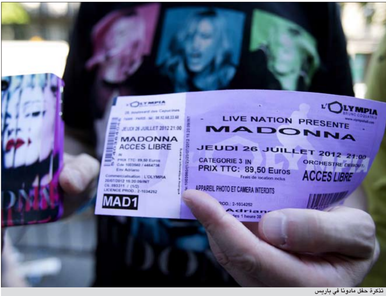
تكررة حفل مادونا في باريس

وأضاف أن الشاب البالغ من العمر 18 سنة اعتقل بعدما كانت نتيجة الفحوص التي أجريت للتأكد من تعاطيه الماريغوانا إيجابية، فيما بعد انتهت لفترة الاختبار المفروضة عليه على خلفية توقيفه سابقاً بسبب الماريغوانا أيضاً. وسيبقى هيلتون في السجن إلى أن يمثل أمام القاضي. ولم يصدر أي تعليق عن عائلة هيلتون.