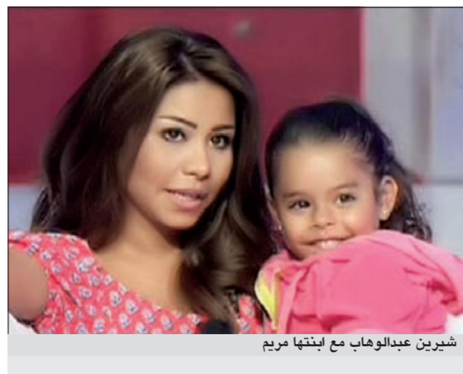
شيرين عبدالوهاب مع ابنتها مريم

نفت النجمة شيرين عبدالوهاب خلال لقائها مع الفنانة نيكول سابا في برنامجها «التفاحة» ما تردد حول قيامها بإجراء عمليات تجميل وأكدت أن كل التغييرات التي طرأت عليها نتيجة فقط لتقدم السن وانقاص الوزن وتطويل الشعر وهو ما غير في شكلها العام. كما استضافت نيكول بالحلقة لأول مرة «مريم» الابنة الكبرى لشيرين عبدالوهاب في أول ظهور تلفزيوني لها والتي غنت معها خلال الحلقة. وتمتد شيرين خلال الحلقة أن تنجب ولدا وأكدت أن زوجها محمد مصطفى يتمتع ذلك أيضا فكان من الواضح أن الحلقة مسجلة منذ فترة طويلة قبل طلاق شيرين، مؤكدة ندمها على عدم تكملة تعليمها حيث توقفت في مرحلة الإعدادية.