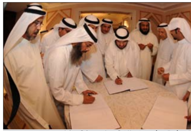
الصيفي الصفي يستعد للتوقيع على عريضة رمضان