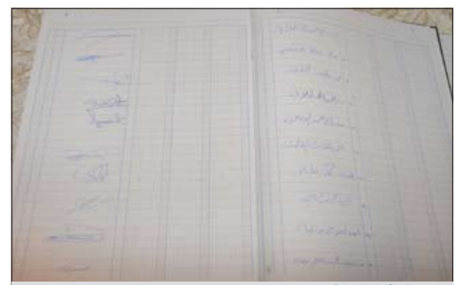
سجل الدائرة الرابعة