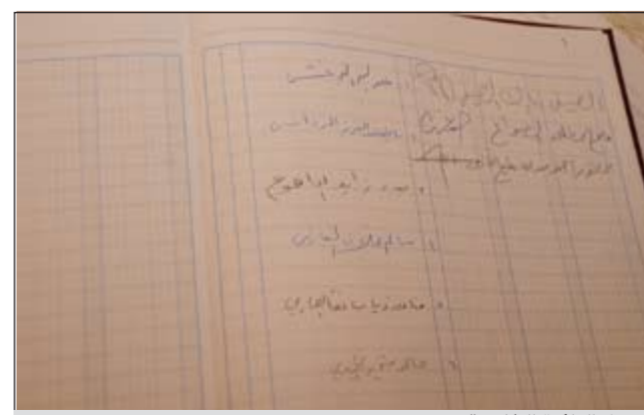
سجل الدائرة الخامسة