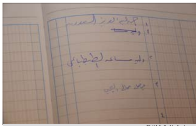
سجل الدائرة الثالثة