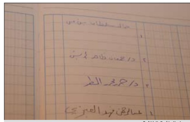
سجل الدائرة الثانية