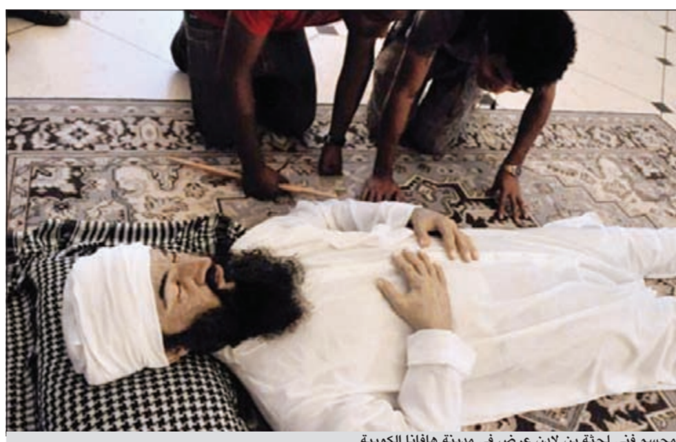
مجسم فني لجة بن لادن عرض في مدينة هافانا الكوبية

وقال مايكل فيكرز، وكيل وزير الدفاع لشؤون الاستخبارات، «انهم سيوفرون شخصا كان مرتبطا في العملية منذ بدايتها كمخطط وقائد في فرقة القوات الخاصة».