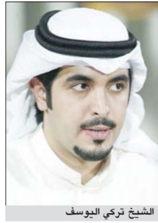
الشيخ تركي اليوسف

الجمهور من خلال مشاهدتهم في تلك الدورات تشهد الدورة مباراة استعراضية مرتقبة بين نجوم الأزرق ونجوم المنتخب المصري. وسيلتقي في المباراة الأولى فريق المرحوم خالد اليوسف مع وزارة الدفاع ثم يواجه التسهيلات فريق المنقاري يتبعهما مواجهة قوية بين تلفزيوني الشاهد مع فريق C7 وتختتم مباريات اليوم الأول بمواجهة فريق العثمان مع المرحوم اوس البناي.