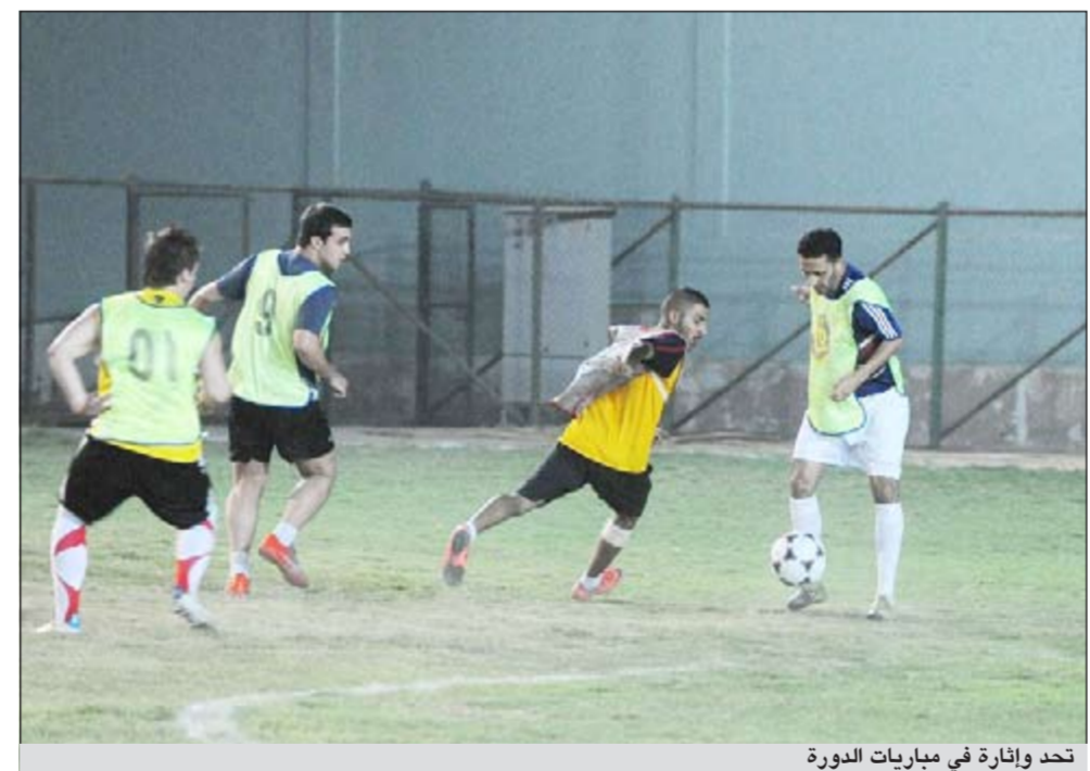
تحذ وإثارة في مباريات الدورة

بداً من 64 وهو عدد الفرق المشاركة في الدورات السابقة لحظوظ خارجة عن الإرادة حيث ستعمل اللجنة المنظمة على دراسة وضع الدورة مستقبلاً وبذل جميع الوسائل الممكنة وتطويرها لتشمل شريحة أكبر من الشباب الكويتي سواء عبر اللاعبين المشاركين أو اللجان العاملة في الدورة. وأكد الفهد أن «شهداء القرين» أصبحت تتمتع بخصوصية مميزة عند أهل الكويت لما تحمله من معان سامية وأهداف نبيلة لذا فان استمرار تنظيمها يعتبر من قبيل الواجب تجاه الكويت وأبنائها البواسل من الشهداء لما يمثلونه من ضمير حي ومثال يحتذى في بذل الدم والروح فداءً للوطن.