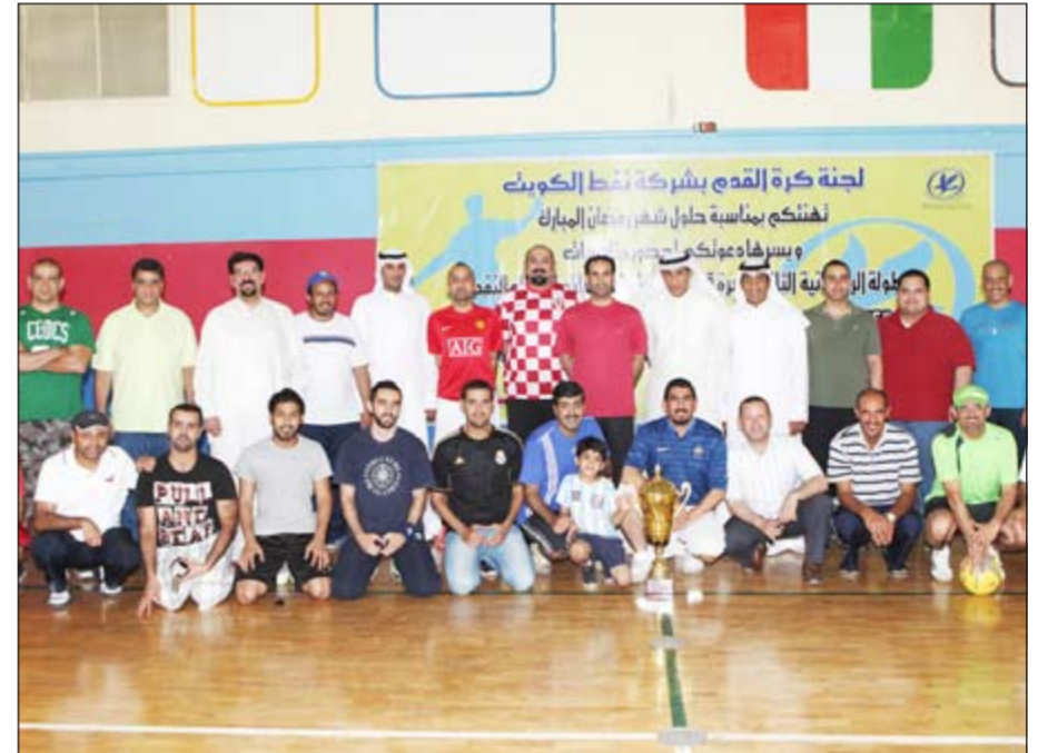
رؤساء الفرق المشاركة مع اللجنة المنظمة قبل انطلاق البطولة

تستكمل في الـ 10 من مساء اليوم الجمعة منافسات الدور التمهيدي في بطولة شركة نفط الكويت الرمضانية الثانية لكرة قدم الصالات لشركات القطاع النفطي والتي تنظمها لجنة كره القدم بشركة نفط الكويت تحت رعاية رئيس مجلس الإدارة والعضو المنتخب سامي الرشيد بمشاركة 32 فريقاً تمثل مختلف الشركات النفطية والقطاعات العاملة فيها وقد تم توزيع الفرق إلى مجموعتين.