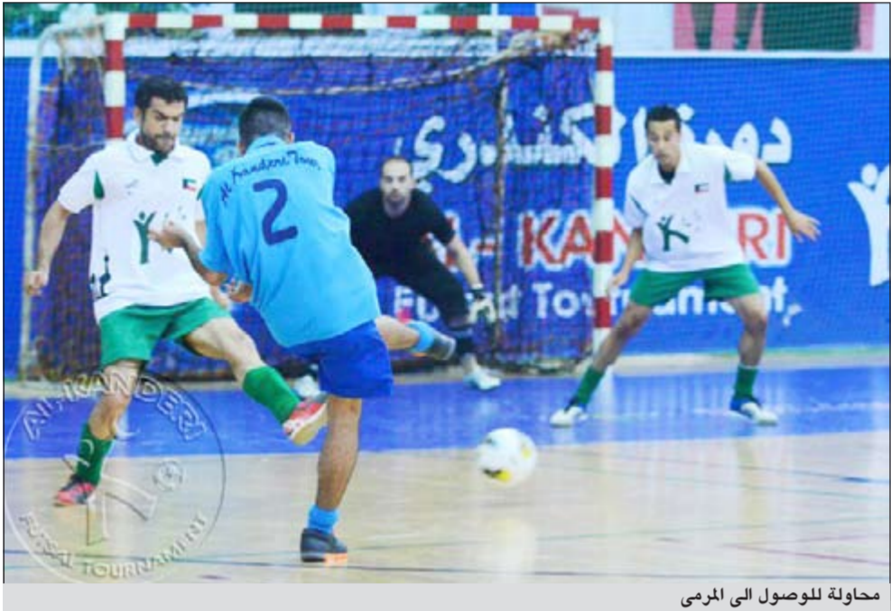
محاولة للوصول الى المرمى

فجان هلال المطيري بنادي القادسية وتبدأ المباريات الساعة 9 مساءً كما يوجد بين المباريات سحب على جوائز قيمة وهدايا للجاليليات.