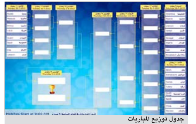
جدول توزيع المباريات

تحت رعاية نائب رئيس مجلس الوزراء وزير الخارجية الشيخ صباح الخالد تقام البطولة الثالثة للسفارات لكرة القدم يوم غد السبت وحتى 2 أغسطس المقبل في صالة