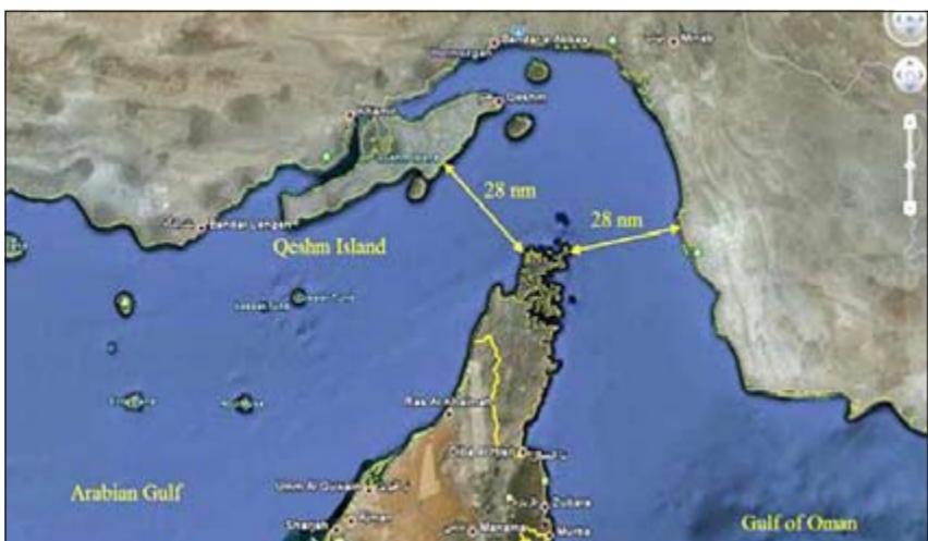
إعداد: محمد البديري