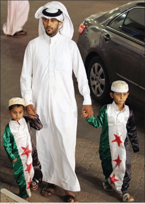
سعودي يصطحب ولديه مرتديين علم الثورة للتبرع للشعب السوري

وقى وقت لاحق، أوردت وكالة الأنباء السعودية أن إجمالي التبرعات النقدية المقدمة للحملة في يومها الأول تجاوز 121,771 مليون ريال، مشيرة إلى أن الحملة استقبلت التبرعات العينية من مواد غذائية وطبية والدوية وملابس وخيام وبطانيات واغطية وجوهرات. وأعلن موقع الحملة السوري السعودية لإغاثة الشعب السوري على الإنترنت أن مبلغ التبرعات