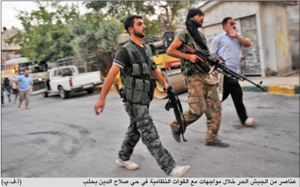
عناصر من الجيش الحر خلال مواجهات مع القوات النظامية في حي صلاح الدين بحلب

وقال شبكة شام الاخبارية المعارضة من جهتها ان مدينة الرستن التابعة لحمص تعرضت لقصف شديد بالطيران وراجعات الصواريخ من قبل قوات الأسد ما أدى إلى مقتل 3 أشخاص وسقوط عشرات الجرحى وتوقعت ازدياد عدد القتلى بسبب قلة المواد الطبية. كما قالت الشبكة ان عددا من المنازل والبساتين والحقول احترقت في بلدة سلمى وديرين وفي القرى الجاورة في محافظة اللاذقية وذلك جراء القصف العشوائي من قبل القوات السورية.