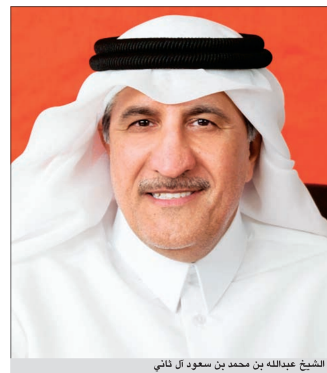
الشيخ عبدالله بن محمد بن سعود آل ثاني

المجمع في نهاية النصف الأول من السنة الحالية عند 47,4 مليون دينار، مقارنة بـ32,5 مليون دينار في الفترة ذاتها في سنة 2011، علما بأن صافي الربح المجمع للنصف الأول لسنة 2011 تضمن مكاسب القيمة العادلة بمبلغ 265,5 مليون دينار وتم الاعتراف بها خلال إعادة التقييم بالقيمة العادلة لحصة الوطنية للاتصالات في أعقاب زيادة حقوق ملكية المساهمين في تونسiana من 50% إلى 75%، وأشارت إلى أن ربحية السهم المجمع في نهاية النصف الأول 2012 بلغت 95 فلسا للسهم مقارنة بـ644 فلسا للسهم في الفترة ذاتها من سنة 2011. وباستثناء مكاسب إعادة تقييم الملكية بالقيمة العادلة تكون ربحية السهم المجمع في النصف الأول 2011 هي 114 فلسا أي بزيادة 16,8% في النصف الأول 2012 عن الفترة ذاتها في سنة 2011.