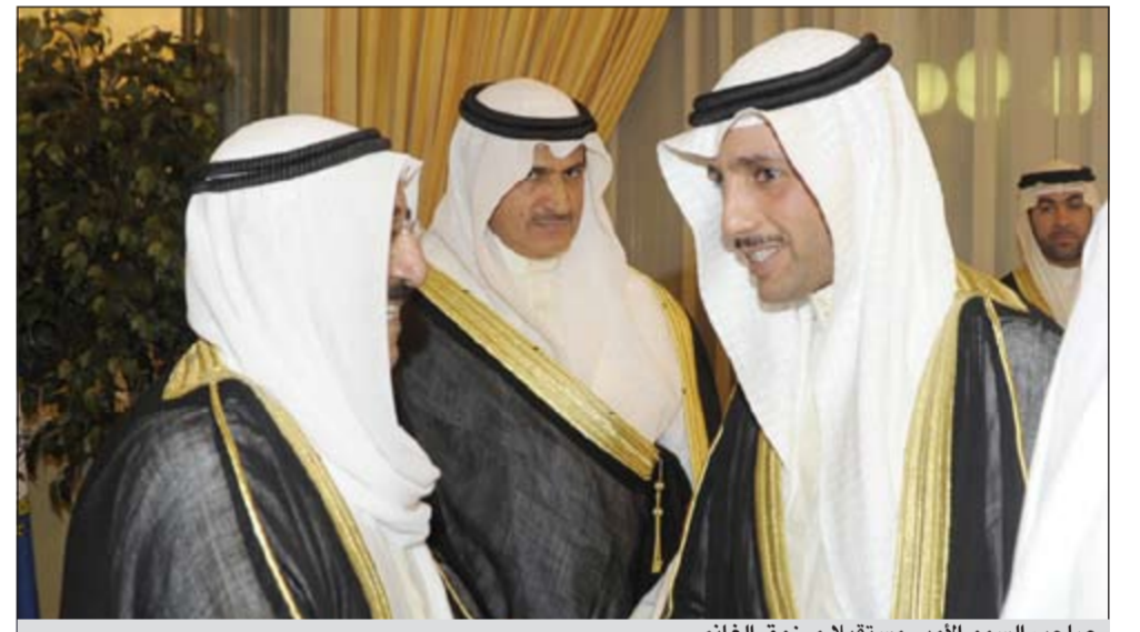
صاحب سمو الأمير مستقبلاً مرزوق الغانم