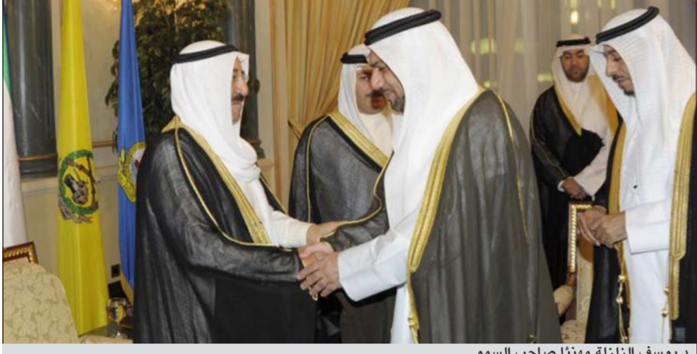
ديوسف الزلزلة مهنتا صاحب السمو