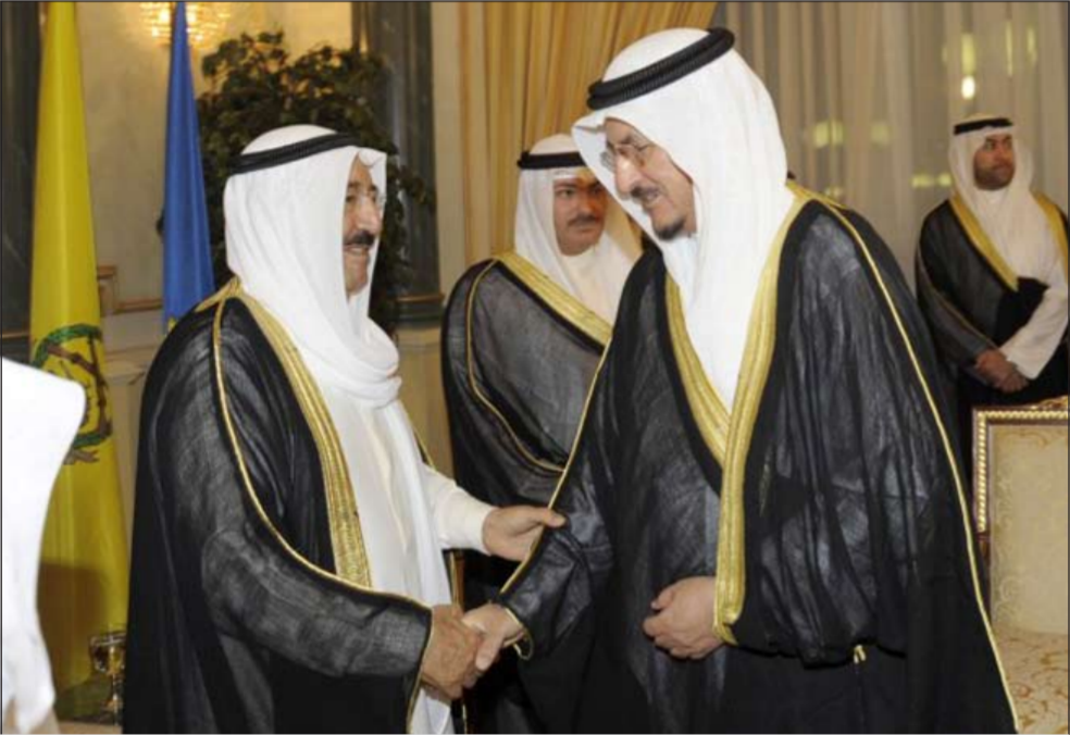
صاحب سمو الأمير مستقبلاً مبارك الدولية