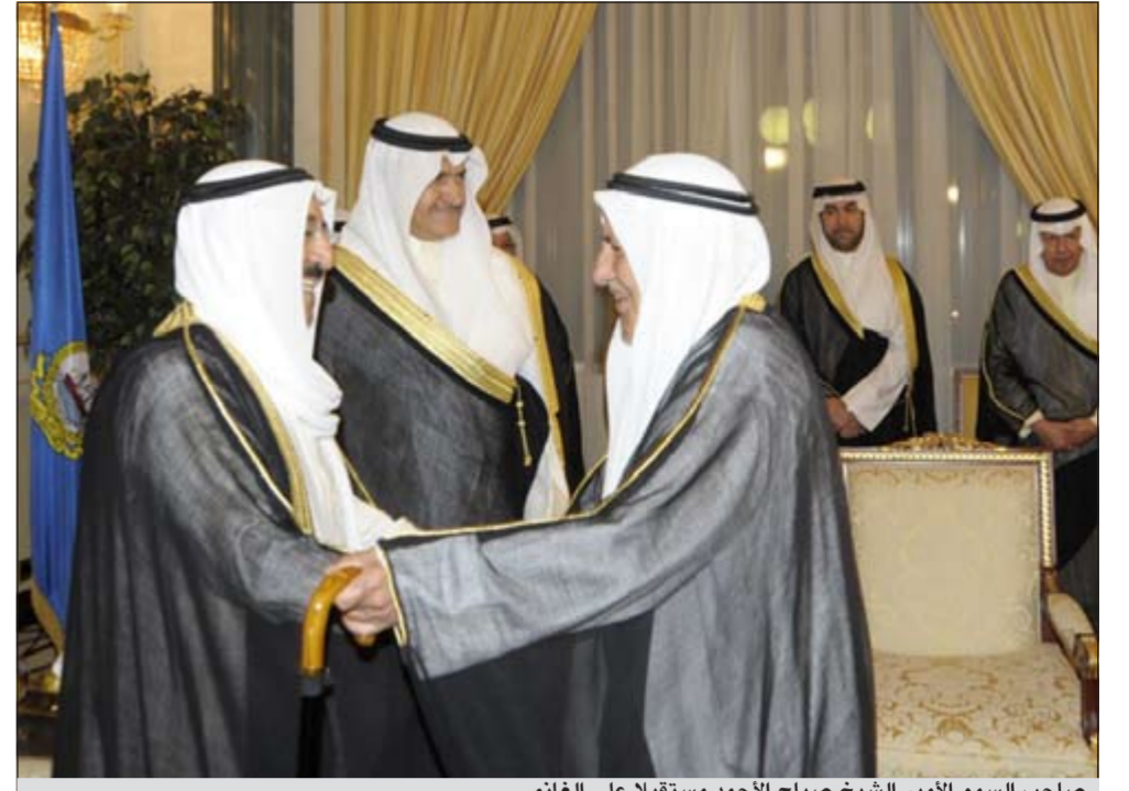
صاحب سمو الأمير الشيخ صباح الأحمد مستقبلاً علي الغانم