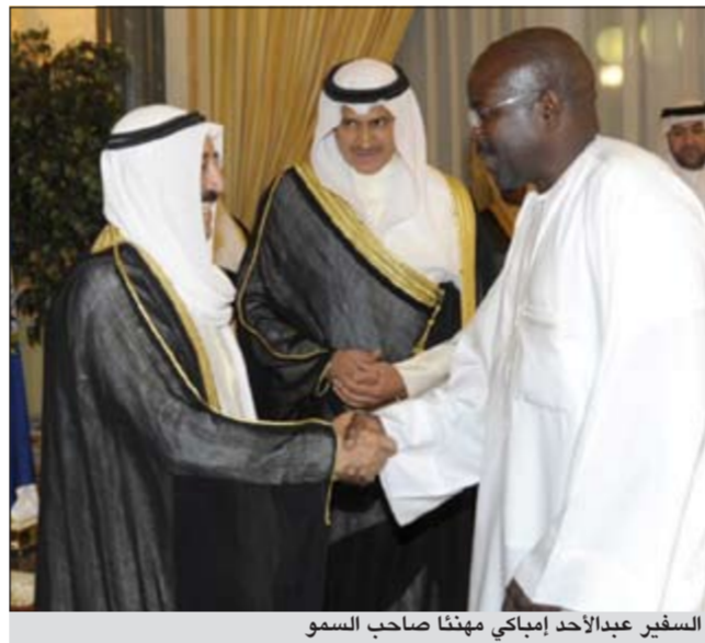
السفير عبدالأحد إمجاكي مهنتا صاحب السمو