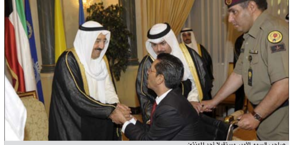
صاحب السمو الأمير مستقبلا أحد المهنتين