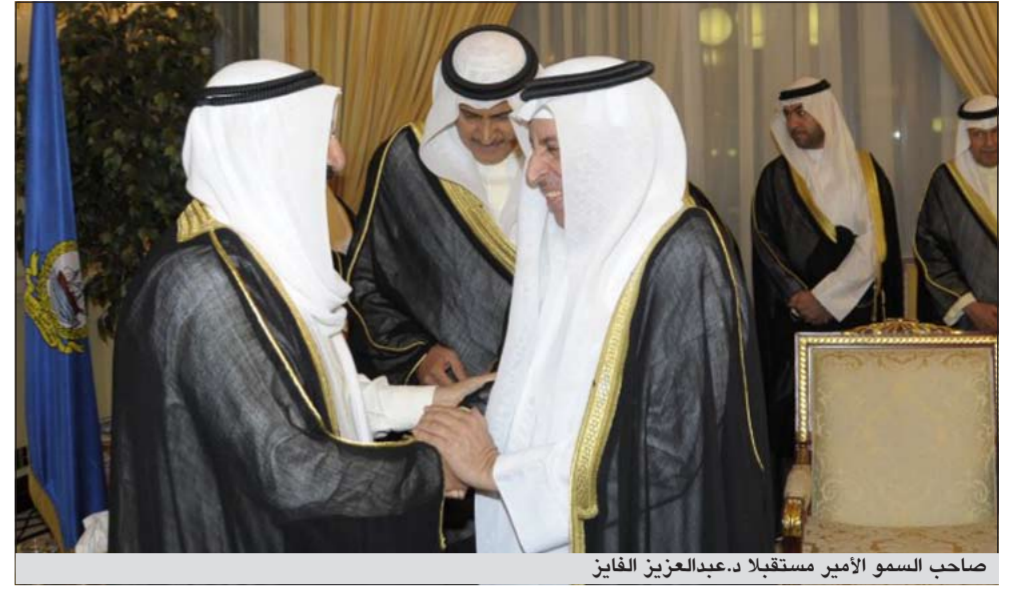
صاحب السمو الأمير مستقبلا د.عبدالعزیز الفایز