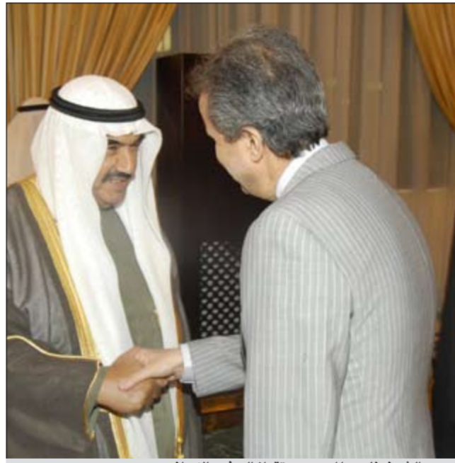
سمو الشيخ ناصر المحمد مستقبلا السفير الإيراني

نرجو ممن يعثر على أي منهم الاتصال على الرقم 66842330 أو تسليمه للسفارة أو أقرب مخفر