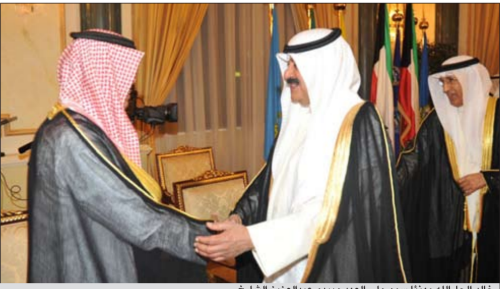
خالد الجارالله مهنتاً سمو ولي العهد ويبدو عبدالعزيز الشارخ

في اجواء تفيض بالود والمحبة استمر توافد المهنيين على ديوان أسرة آل الصباح الكرام بقصر بيان مساء امس الاول وذلك لتهنئة صاحب سمو الامير الشيخ صباح الاحمد وسمو ولي العهد الشيخ نواف الاحمد واسرة آل الصباح الكرام بحلول شهر رمضان المبارك لليوم الثاني على التوالي حيث استقبل رؤساء البعثات الدبلوماسية المعتمدين لدى الكويت وجموعاً من المواطنين والمقيمين. وتأتي هذه المناسبة لتجسد روح الوحدة التي جبل عليها الشعب الكويتي الذي يتميز بالحب والمودة وروح الاخاء، وتؤكد على التواصل والارتباط بين كافة اطراف المجتمع الكويتي في مثل هذه المناسبات اعادها الله علينا بالخير واليمن والبركات.