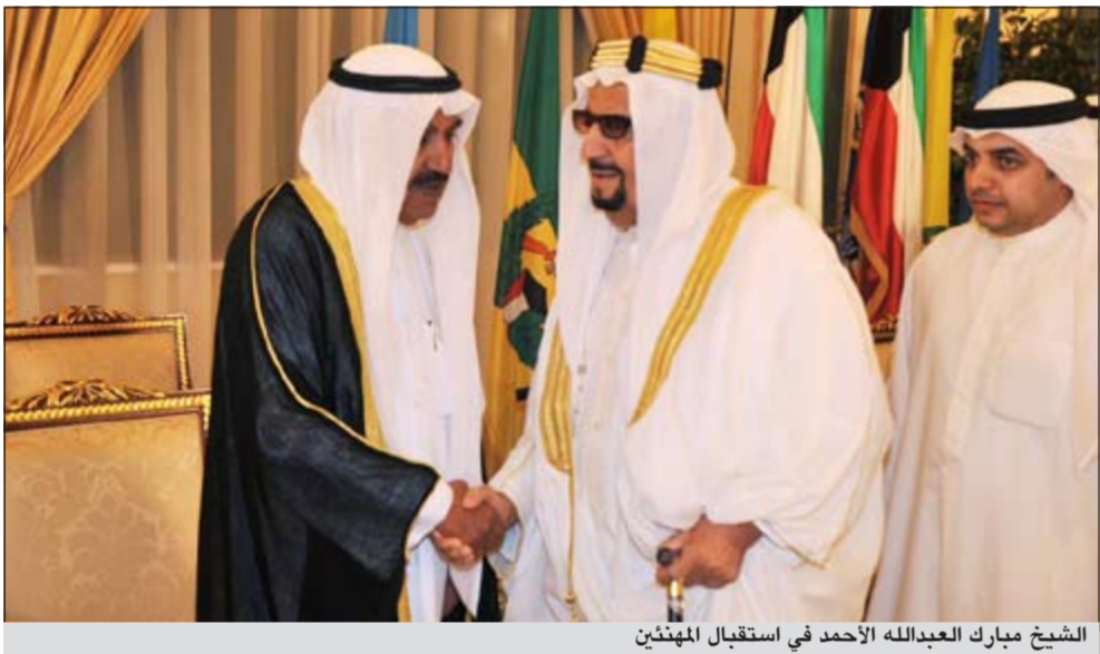
الشيخ مبارك العبدالله الاحمد في استقبال المهنتين