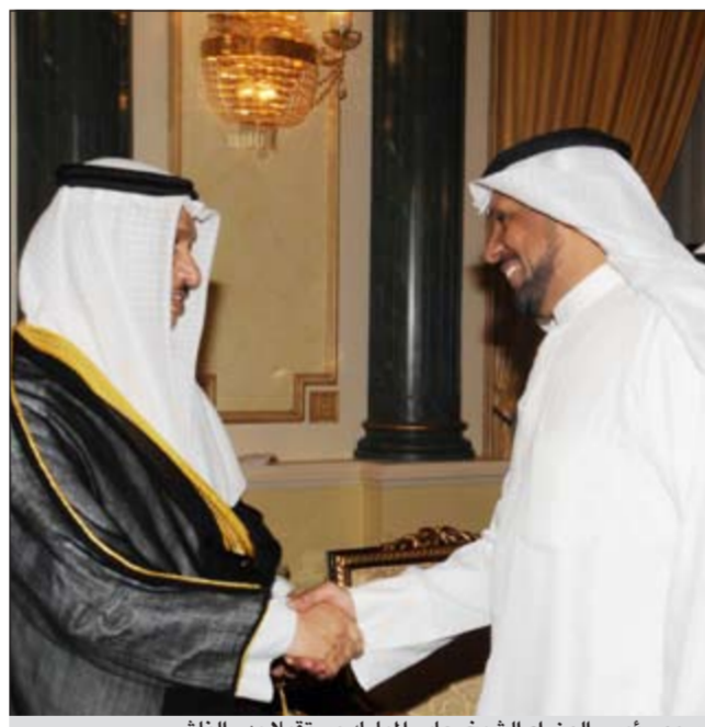
سمو رئيس الوزراء الشيخ جابر المبارك مستقبلا بدر الناش