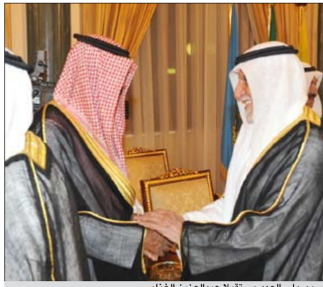
سمو ولي العهد مستقبلاً عبدالعزيز الغانم