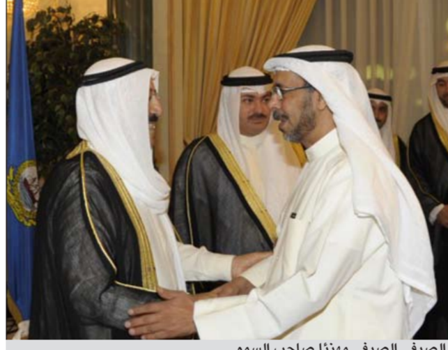
الصيفي الصيفي مهنتا صاحب السمو