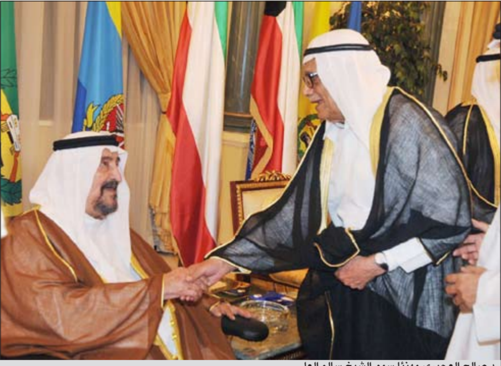
د.صالح العجيري مهنتاً سمو الشيخ سالم العلي