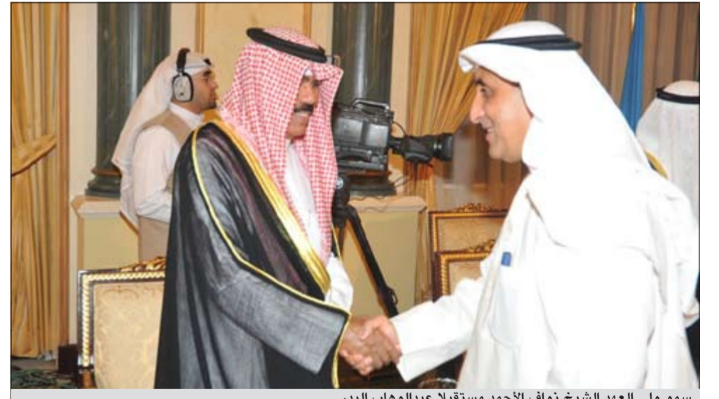
سمو ولي العهد الشيخ نواف الاحمد مستقبلاً عبدالوهاب الجبر