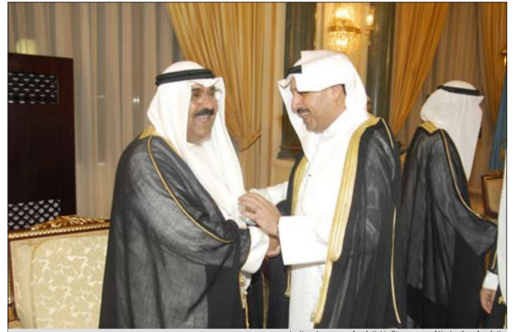
الشيخ مشعل الاحمد مستقبلا الشيخ حمد جابر العلي