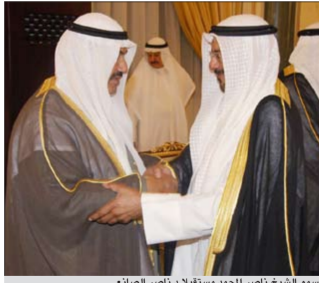
سمو الشيخ ناصر المحمد مستقبلاً د.ناصر الصانع