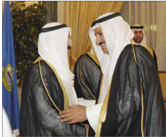
صاحب سمو مضافاً حسين الحريتي