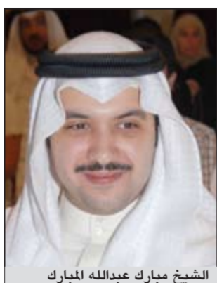
الشيخ مبارك عبدالله المبارك