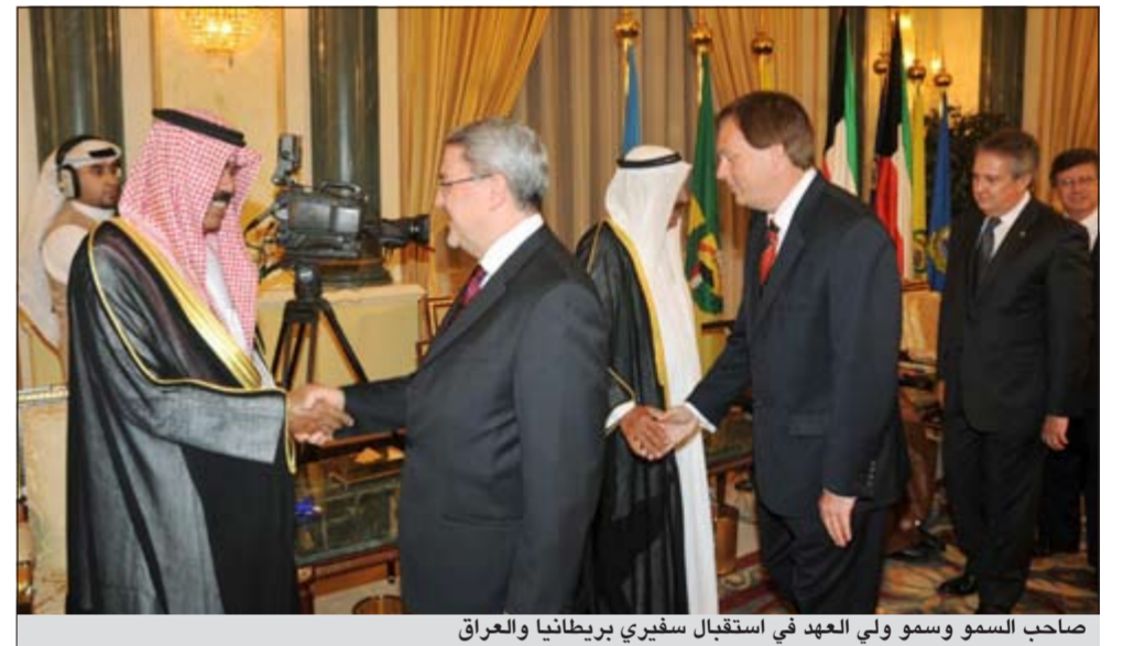
صاحب السمو وسمو ولي العهد في استقبال سفير بريطانيا والعراق