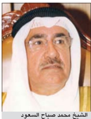
الشيخ محمد صباح السعود

يستقبل أبناء المغفور له الشيخ عبدالله المبارك الصباح - طيب الله ثراه - المهنيين بقدم رمضان.. مساء اليوم (الاثنين) وغدا الثلاثاء بعد صلاة العشاء وذلك في القصر الأبيض المطل على الدائري الرابع بمنطقة السرة، كما يستقبلون رواد الديوانية في القصر كل يوم ثلاثاء بعد صلاة العشاء. اعاده الله على الكويت واهلها وعلى الجميع بالخير والبركات.