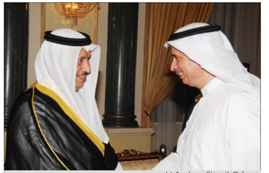
ديوسف الإبراهيم مهنتا سمو رئيس الوزراء