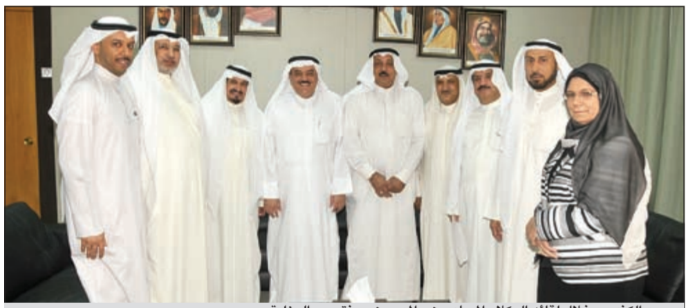
محمد الكندري خلال لقائه الوكلاء المساعدين والمديرين ومنتسبي الوزارة

طالب وكيل وزارة الشؤون الاجتماعية والعمل محمد الكندري قيادات الوزارة على جميع مستوياتهم بضرورة متابعة ومراقبة القطاعات والإدارات التابعة لهم خلال هذا الشهر الفضيل تأكيداً على حسن سير العمل والالتزام بالجميع بالدوام لإنهاء إجراءات المعاملات الخاصة بالمراجعين وعدم التهاون في محاسبة المقصرين واعتبار هذا الشهر كما عرف عنه شهر العمل والطاعة والعبادة، وأعرب عن تمنياته وتهنئته وأركان ومنتسبي الوزارة للقيادة السياسية وعلى رأسها صاحب السمو الأمير وسمو ولي العهد وسمو رئيس مجلس الوزراء والحكومة والشعب الكويتي الكريم بمناسبة شهر رمضان المبارك وأن يحفظ الله الكويت وشعبها من كل مكروه وأن يعيد علينا وعلى الأمتين الإسلامية والعربية هذا الشهر الكريم بالخير والبركة والاستقرار. جاء ذلك خلال استقبال الوكيل للوكلاء المساعدين والمديرين ومنتسبي الوزارة للتهنئة بمناسبة حلول شهر رمضان المبارك.