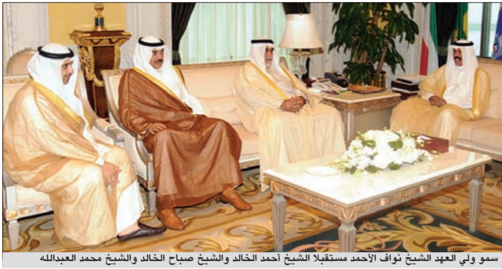
سمو ولي العهد الشيخ نواف الأحمد مستقبلاً الشيخ أحمد الخالد والشيخ صباح الخالد والشيخ محمد عبدالله

وقد أعرب معاليه عن خالص تهنئه وأطيب تمنياته لسموه بحلول شهر رمضان المبارك سائلاً المولى عز وجل أن يعيده على سموه بموفور الصحة والسعادة وعلى الكويت قيادة وحكومة وشعباً بمزيد من التقدم والأزدهار والرفعة والنماء تحت القيادة الحكيمة لصاحب السمو الأمير الشيخ صباح الأحمد. وقد بادله سموه التهاني الودية المقرونة بأصدق الأمنيات الأخوية مبتهلاً إلى المولى العلي القدير أن يعيد هذه المناسبة السعيدة على قطر وشعبها الوفي بموفور العزة والرخاء في ظل القيادة الرشيدة لسمو الأمير حمد بن خليفة آل ثاني وعلى الأمتين العربية والإسلامية بالخير واليمن والبركات وقد تحققت لها كل ما تصبو إليه من رقي وتقدم وان يسود العالم الأمن والاستقرار.