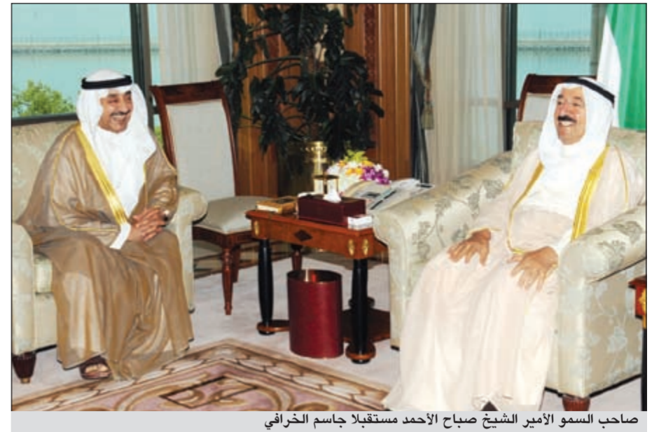
صاحب السمو الأمير الشيخ صباح الأحمد مستقبلاً جاسم الخرافي

سمو رئيس مجلس الوزراء الشيخ جابر المبارك. كما استقبل سموه بقصر السيف صباح أمس النائب الأول لرئيس مجلس الوزراء ووزير الداخلية الشيخ أحمد الحمود.