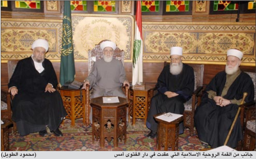
جانب من القمة الروحية الاسلامية التي عقدت في دار الفتوى أمس