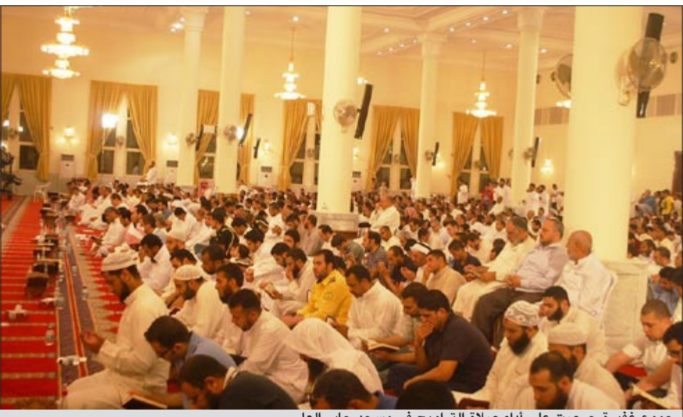
جموع غفيرة حرصت على أداء صلاة التراويح في مسجد جابر العلي