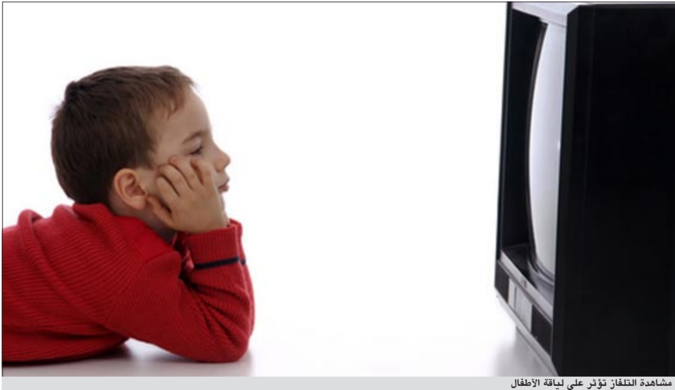
مشاهدة التلفاز تؤثر على لياقة الأطفال

في مشاهدة التلفاز تتعرض عضلاتهم ولياقتهم البدنية إلى التضرر، الأمر الذي يؤدي إلى زيادة حجم الخصر في مرحلة المراهقة. وشملت الدراسة حوالي 1314 طفلاً تراوحت أعمارهم بين 2 و5 سنوات وصولاً إلى سن العاشرة، وقد شاهد الأطفال في المتوسط حوالي 8 ساعات من برامج التلفاز أسبوعياً، وارتفع هذا الرقم إلى نحو 14 ساعة.