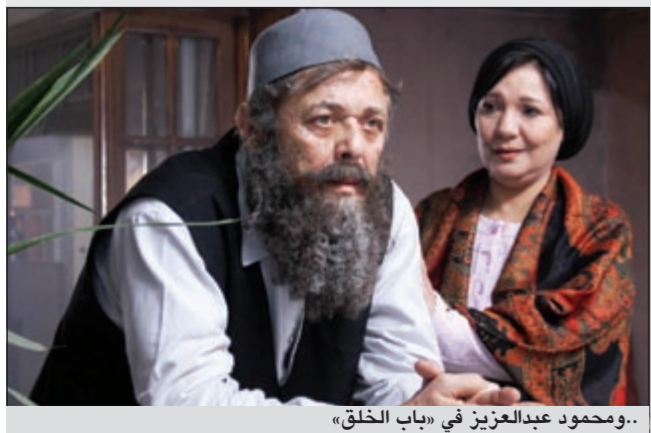
..ومحمود عبدالعزيز في «باب الخلق»