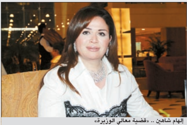
إلهام شاهين .. قضية معالي الوزيرة»