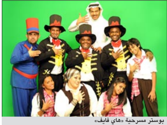
بوستر مسرحية «هاي فايف»

أكد نجم مسرح الطفل عبدالرحمن العقل لـ «الأنباء» أنه يحرص من خلال مسرحياته التي يقدمها للطفل على أن تحمل بين طياتها الكثير من المبادئ التربوية، وذلك لترسيخها في ذهن الطفل، خصوصا أن الطفل حاليا يختلف عن السابق. وقال: نص «هاي فايف» الذي كتبته يوجد فيه العديد من الأهداف التربوية التي حرصت على أن تكون من ضمن حوارات المسرحية التي ساقدمها في عيد الفطر على خشبة مسرح تنمية المجتمع بمنطقة الزهراء وأتمنى أن تنال هذه المسرحية إعجاب الأطفال وأسرهم.