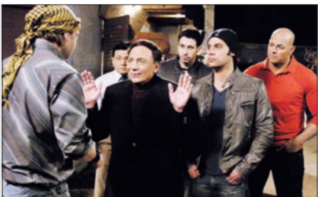
عادل إمام في مسلسل «فرقة ناجي عطا الله»