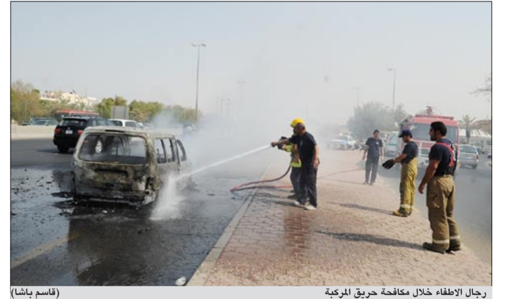
رجال الاطفاء خلال مكافحة حريق المركبة

كثبت النجاة لوافد مصري التهمت النيران سيارته اليابانية على طريق المطار بسبب التماس كهربائي. وتوجه رجال اطفاء الشويخ، حيث تم اخماد المركبة التي ابلتعت النيران اجزاء كبيرة منها واحالتها الى هيكل حديدي، فيما خرج قائدها دون ان تلحق به اي اصابات تذكر. ووفق رواية لرجال الاطفاء فإنه لاحظ دخانا كثيفا يخرج من الطبلون فتوقف ليستطلع منها واحالتها الى هيكل حديدي حتى اندلعت فيها النيران قائلا: لو بقيت فيها 5 ثوانٍ لكانت قد احترقت بداخلها.