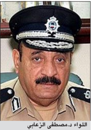
لواء د.مصطفى الزعابي

ودعا اللواء د.الزعابي مستخدمي الطريق الى توخي الحذر والتقيد بقواعد وقوانين المرور ضمانا لسلامة الجميع، خاصة ان أخلاقيات الصيام يجب ان تحول دون ارتكاب السائقين لهذه المخالفات، مؤكدا ان رجال المرور يقفون بالمرصاد لكل متجاوز، ويعملون جاهدين على تأمين الطرق والحفاظ على سلامة مرادها بضغط المخالفين واتخاذ الإجراءات القانونية المقررة ضدهم. وأهاب بالأخوة المواطنين والمقيمين الذين يسافرون لأداء العمرة عن طريق البر التزام الحيطة والحذر، والقيام بالصيانة الدورية والتوسمية للمركبات، وتطبيق شروط الأيمن والمتانة حماية لهم ولرفاقهم. وأوضح اللواء د.الزعابي ان ما يطلبه من دوريات المرور هو مواصلة جهودهم بنفس الحماس طوال شهر رمضان