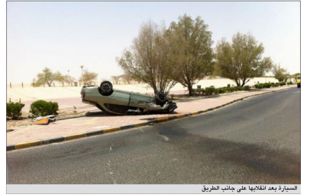
السيارة بعد انقلابها على جانب الطريق

ادى انقلاب مركبة يابانية الى دخول واقد عربي مستشفى الجهراء صباح امس عند احد دوارات منطقة النسيم، وعليه سجلت قضية. وفي التفاصيل التي يرويها المصدر ان بلاغا ورد من احد المارة يقيد بوجود انقلاب مركبة بالقرب من دوار منطقة النسيم ليجتبه على الفور رجال