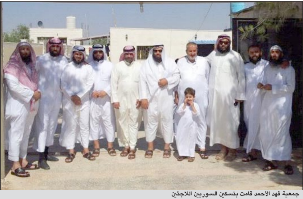
جمعية فهد الأحمد قامت بتسكين السوريين اللاجئين

كثيرا، مبينا أن من المشاريع التي نفذت في مخيمات اللاجئين السوريين في الأردن حيث وجهت جميع المساعدات التي تبرع بها الشعب الكويتي إلى إخوانهم السوريين في الأردن حيث أنهى الفريق الإغاثي التابع للجمعية مشروع كفالة بنائية أسر الشهداء والمستشفى الميداني الذي يعالج فيه المصابون ويرعى كبار السن والنساء والأطفال كما لايزال الفريق يوزع المؤن الرمضانية في مخيمات الرمثا.