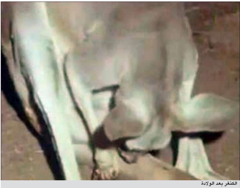
الكنغر بعد الولادة