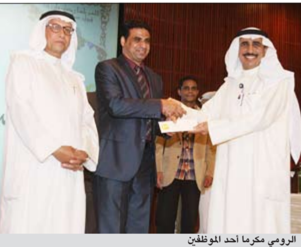
الرومي تكريماً أحد الموظفين