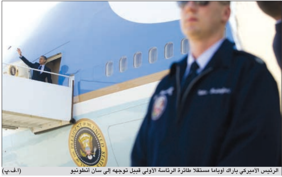
الرئيس الأميركي باريك أوباما مستقلاً طائرة الرئاسة الأولى قبيل توجهه إلى سان أنطونيو

تحولت قضية الدخل الشخصي لميت روماني وعائلته إلى قضية انتخابية حين شن أنصار الرئيس باريك أوباما حملة مكثفة على المرشح الجمهوري لإرغامه على الإفصاح عن ذلك الدخل ونشر البيانات التي قدمها لمصلحة الضرائب في الأعوام الماضية.