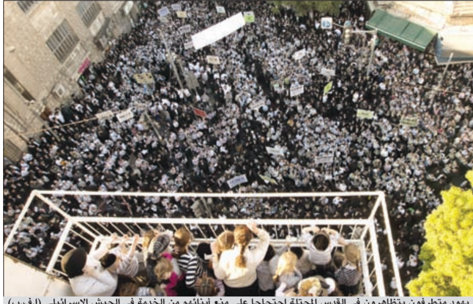
يهود متطرفون ينظفون في القدس المحتلة احتجاجا على منع إبانهم من الخدمة في الجيش الإسرائيلي

وأكدت أن هذه الخطوة التهودية هي بمثابة إعلان واضح وصريح لاحتلال المسجد الأقصى وبكل تعنت وعنجهية وعلى مرأى العالم أجمع وسلخه