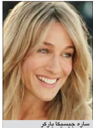
ساره جيسكا باركر