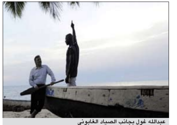
عبدالله غول بجانب صياد الغابوني

الغابون - وكالات: أقيمت في الغابون مراسم رسمية لتسليم محرك مركب صيد كان الرئيس التركي عبدالله غول وعد بإهدائه إلى صياد قابله صدقة العام الماضي.