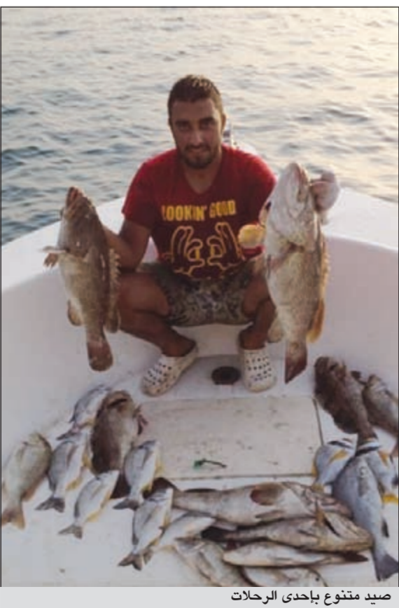
صيد متنوع بإحدى الرحلات