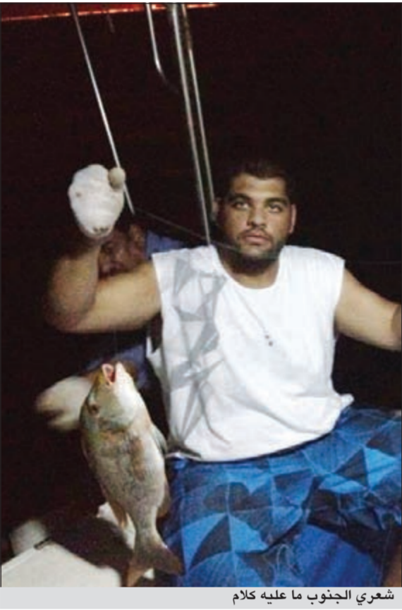
شعري الجنوب ما عليه كلام