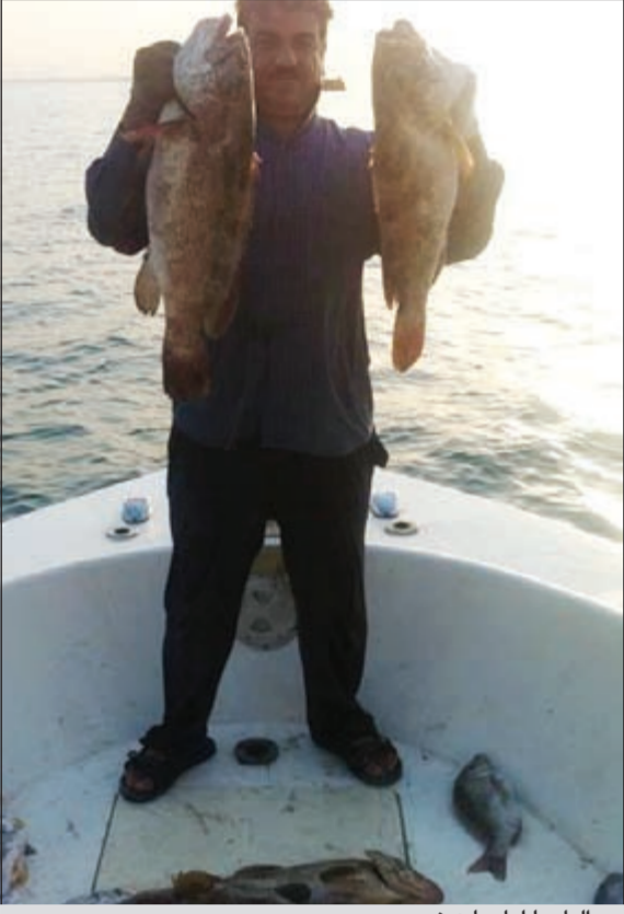
بوليل يا ليل يا عين