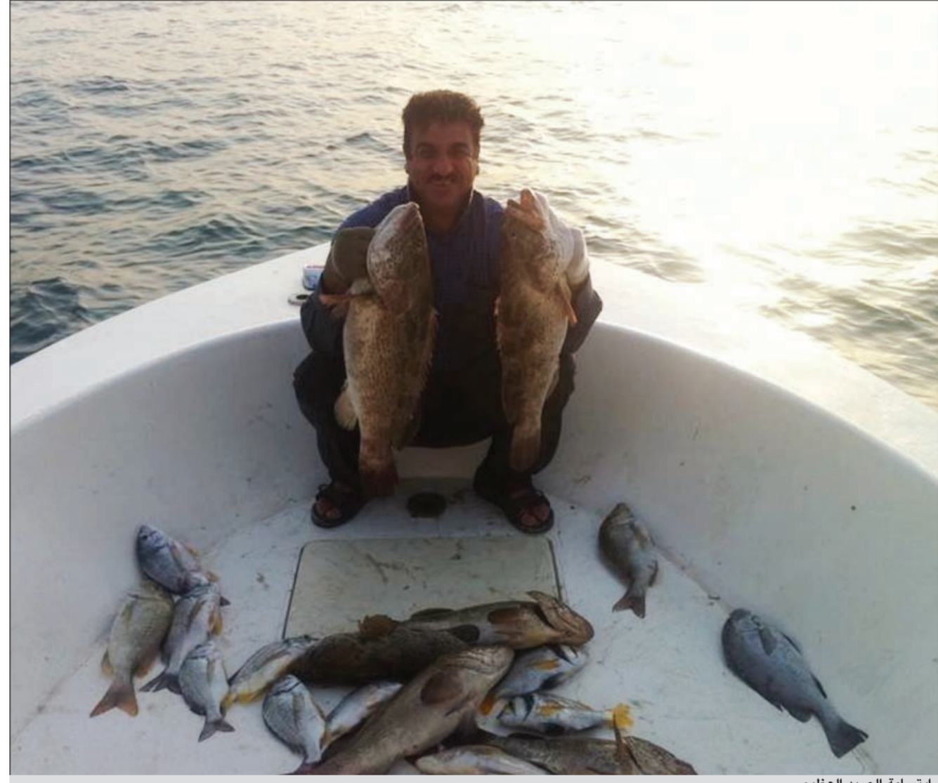
إبتسامه الصيد العظيم

البالول والنقرور بحرنا أكره بهما فما أفضل أمكنتهما؟ ● بالنسبة للبالول فهو موجود