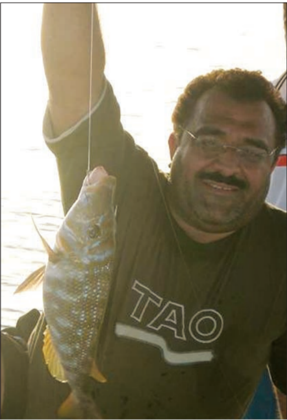
شوف الشعري وتعلم