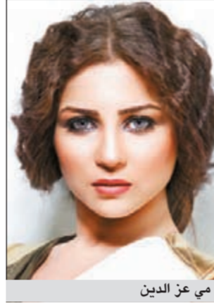
مي عز الدين