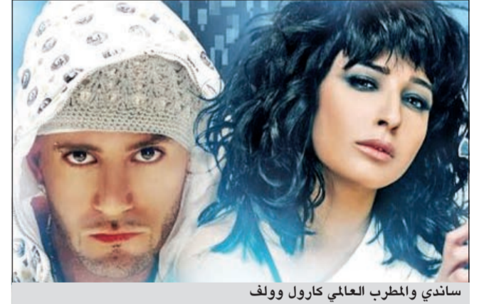
ساندي والمطرب العالمي كارول وولف

القاهرة: انتهت الفنانة ساندي والمطرب العالمي كارول وولف من تصوير أغنية «أول مرة أتجراً» على طريقة الفيديو كليب مع المخرج عادل حقي، وتم تسجيل الأغنية في أحد الاستوديوهات في ألمانيا. وتم التحضير للكلب، بحسب «إيلاف»، قبل التصوير بحوالي شهر بين استحضار الفكرة وتنفيذها، واستغرق تصوير الكليب 3 أيام في دبي، وتعتمد فكرة الكليب على الاستعراضات بطريقة جديدة متناغمة تجمع بين العصرية والكلاسيكية وتظهر ساندي في هذا الكليب بأكثر من لوك وبشكل جديد، وتعاونت ساندي في هذا الكليب مع مصمم الأزياء العالمي روبرتو كافالي وألكسندر ماكوين.