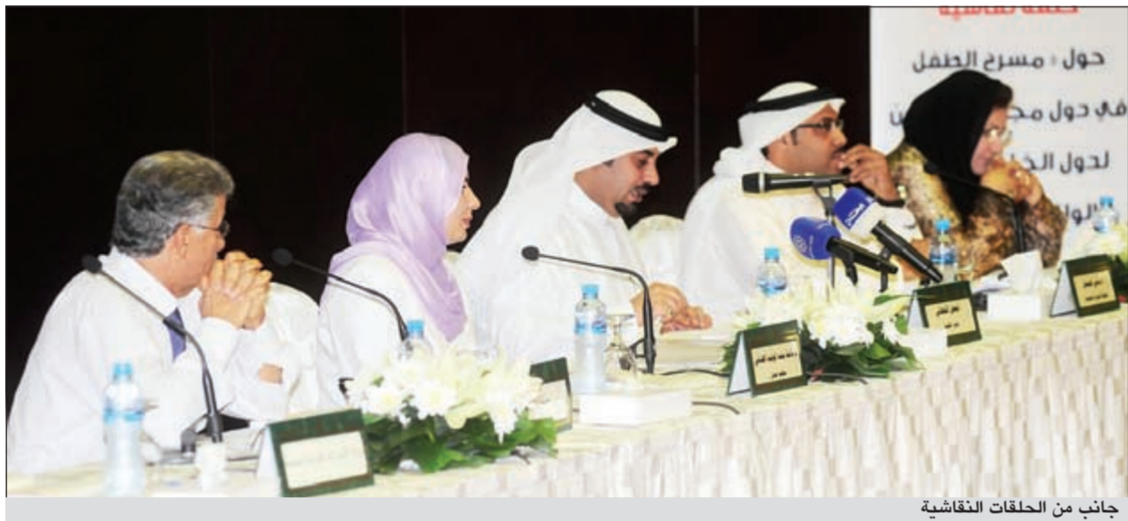
جانب من الحلقات النقاشية