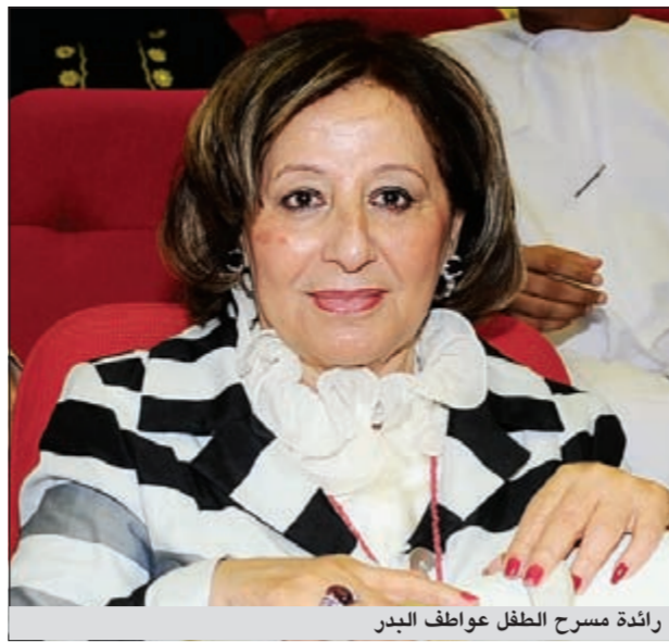
رائدة مسرح الطفل عواطف البدر