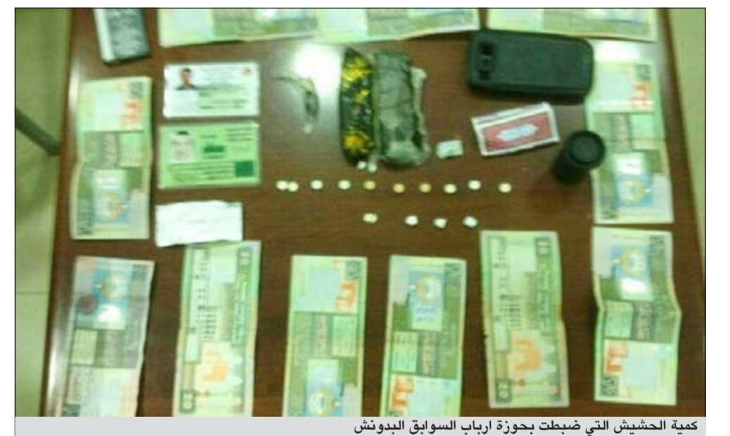
كمية الحشيش التي ضبطت بحوزة أرباب السوابق البيدوش

تمكن رجال امن محافظة الجهراء من ضبط دون من أرباب السوابق بـ«كفين» من مادة الحشيش المخدرة وكمية من الأموال التي قال انه تحصل عليها عن طريق كمية من الحشيش، معترفا بأنه يعمل موزعا لصالح احد الاشخاص.