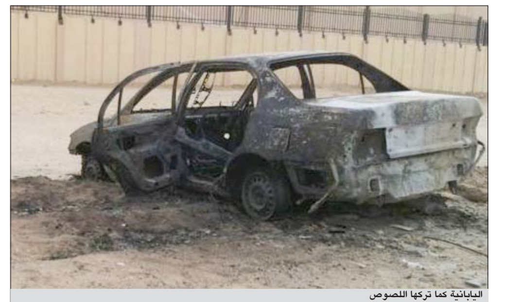
اليابانية كما تركها للصوص

أقدم مجهولون على احراق مركبة يابانية مساء امس الاول في المنطقة الفاصلة بين منطقتي تيماء والنسيم ليقوم رجال الاطفاء باخماد نيران المركبة التي اتضح انها مسروقة.