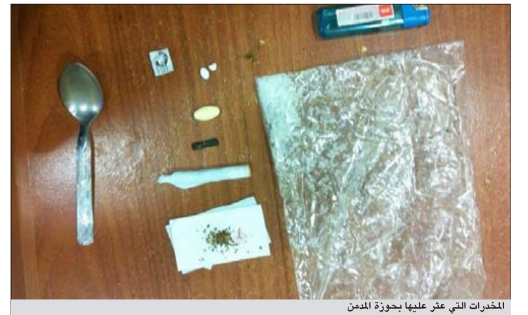
المخدرات التي عثر عليها بحوزة المدمن

تمكن رجال سرية المهام الخاصة من القاء القبض على مواطن وبحوزته مخدرات متنوعة وذلك خلال جولة تفتيشية في منطقة الجهراء أمس الأول، ووفق مصدر أمني فإن رجال فرقة سرية المهام الخاص وأثناء تجولهم في منطقة العمارين بمنطقة الجهراء رصدوا سيارة متوقفة في مكان يثير الريبة وبدخلها شخص بضيء الأنوار الداخلية، وعليه توجه له رجال الأسرية وحال تحدثهم معه تبين أنه كان بحالة غير طبيعية وبتفتيش