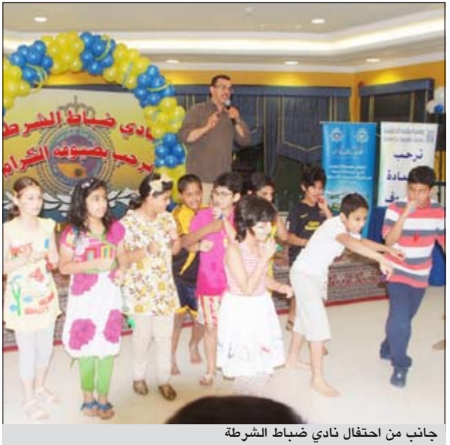
جانب من احتفال نادي ضباط الشرطة

في إطار الفعاليات والأنشطة التي يقدمها نادي ضباط الشرطة وتفاعل رواد النادي والإقبال عليها من أسرى ضباط وزارة الدفاع ومنتسبي النادي ومن خلال تنوع هذه الأنشطة والبرامج التي تخلق جوا من المرح والمعرفة والثقافة.