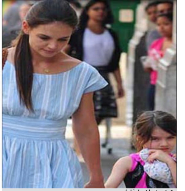
كيتي هولمز وابنتها

لوس انجليس - د.ب.أ: ذكرت تقارير إخبارية أن الممثلة كيتي هولمز قيدت ابنتها «سوري»، 6 أعوام، في مدرسة كاثوليكية للفتيات في نيويورك.