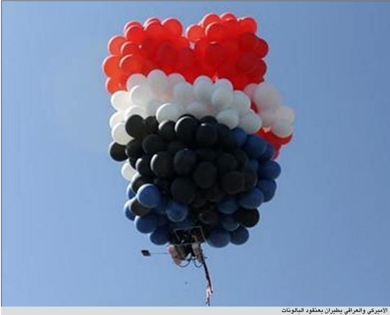
الأميركي والعراقي يطيران بعنقود الباليونات

وذكر موقع صحيفة «اكسبريس» البريطانية أن شين كان قد سجل في الموقع في مارس 2011، بعد أن تم تعليق عمله في المسلسل التلفزيوني الكوميدي «رجلان ونصف». ومنذ تسجيله، ظل شين مدونا نشيطا يطلع متابعيه البالغ عددهم ما يربو على 7,7 ملايين معجب على تفاصيل حياته الجامحة، وروج «شين» مؤخراً على الموقع لبرنامج الكوميدي الجديد «التحكّم بالغضب».