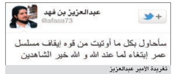
تغريدة الأمير عبدالعزيز

صرح الأمير عبدالعزيز بن فهد بن عبدالعزيز نجل ملك السعودية الراحل أمس عبر حسابه في «تويتر»، الذي يتابعه أكثر من نصف مليون متابع بأنه سيجادل بكل ما أوتي من قوة إيقاف عرض مسلسل «عمر» مشيراً إلى أنه يريد بهذا العمل ابتغاء وجه الله.