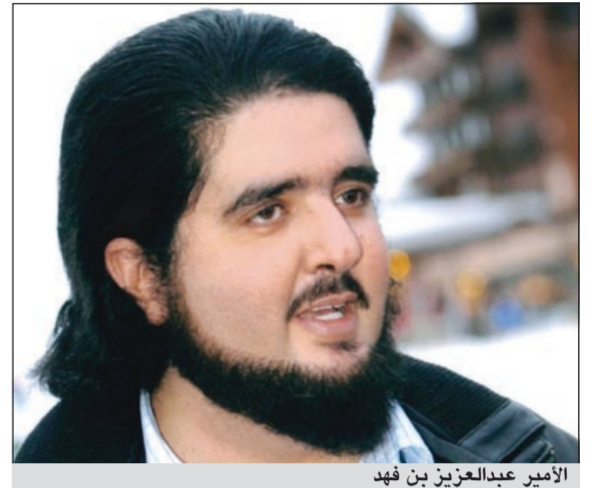
الأمير عبدالعزيز بن فهد

صرح الأمير عبدالعزيز بن فهد بن عبدالعزيز نجل ملك السعودية الراحل أمس عبر حسابه في «تويتر»، الذي يتابعه أكثر من نصف مليون متابع بأنه سيجادل بكل ما أوتي من قوة إيقاف عرض مسلسل «عمر» مشيراً إلى أنه يريد بهذا العمل ابتغاء وجه الله.