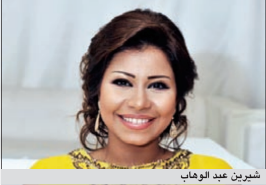
شيرين عبد الوهاب

على مدى قوة العلاقة بينهما وأنهما من أنجح الأزواج في الوسط الفني، أكدت الصحافة المصرية على اختفاء شيرين عبد الوهاب عن الأنظار تماما ولم تعد ترد على هاتها الحمل للتعليق على خبر الانفصال، كذلك فعل زوجها السابق الذي أغلق أيضا هاتفه. هذا ويتوقع ان تصل شيرين الى بيروت الاثنين المقبل للمشاركة في المؤتمر الصحفي الذي ستعقدته قناتة الـ «أم بي سي» للإعلان عن برنامجها الجديد «The Voice»، حيث تشارك شيرين في لجنة التحكيم الى