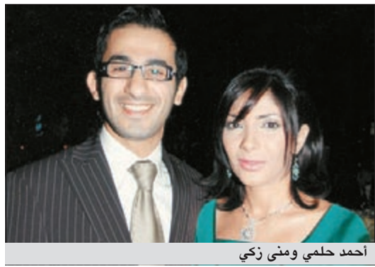
أحمد حلمي ومنى زكي