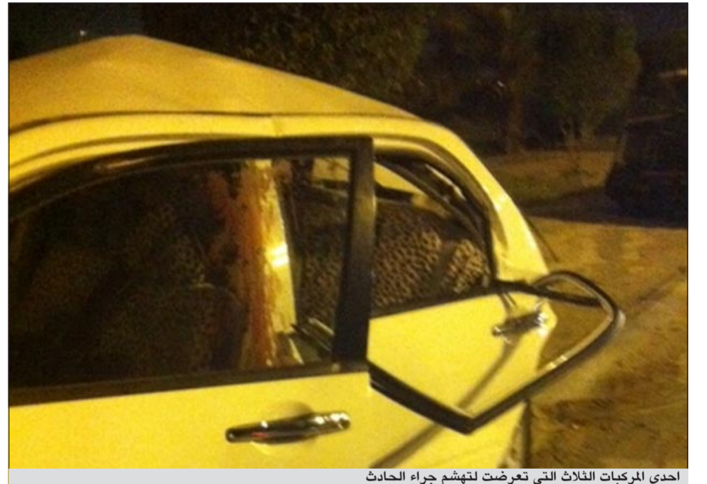
أحدى المركبات الثلاث التي تعرضت لتفهم جراء الحادث