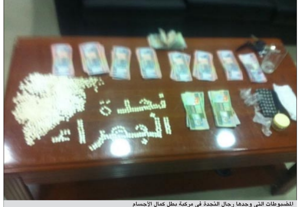
المضبوطات التي وجدها رجال النجدة في مركبة بطل كمال الأجسام

الطلب من قائدها التوقف إلا أنه لم يمتثل لرجال النجدة حيث تم طلب الإسناد وتضييق الخناق على قائدها السدي أجبر على التوقف فترجل من سيارته ليتم ضبطه بعد مقاومته والاعتداء عليهم الا ان رجال الأمن والذين وصل عددهم الى 12 عسكريا (ضابط وفرد) استطاعوا أن يسيطروا على «المجسم» وتبين أنه مواطن في العقد الثالث من العمر وأفاد بأنه بطل الكويت لعام 2010 وبالإستعداد عنه تبين انه مطلوب للعديد من القضايا الجنائية والمدنية وبتفتيش سيارته عثر على نحو 1000 حبة كبتاغون مخسر و1500 دينار ارفقت في مخفر القضية التي بسببها تمت احالة المتهم الى مكافحة المخدرات.